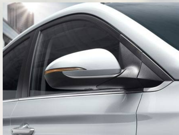
איתות במראות צד