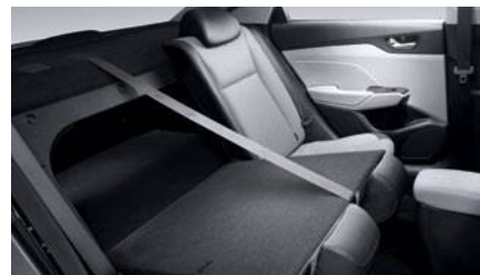
מושבים מתקפלים (ביחס 40:60)