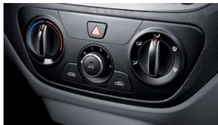
מערכת מיזוג אוויר