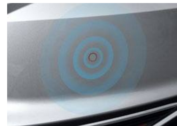
חיישני חנייה אחוריים