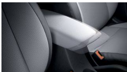
משענת יד מתכווננת