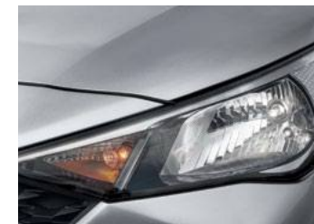
פנסי הלוגן ראשיים