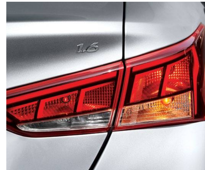
פנסים אחוריים מעוצבים