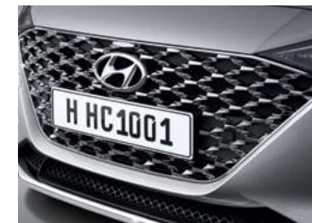
שבכה קדמית מעוצבת