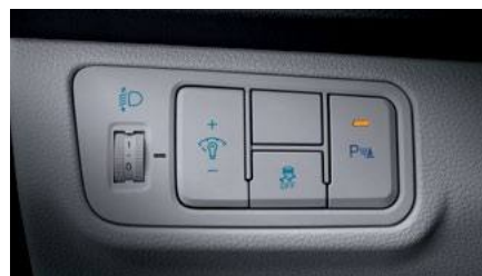
בקרת יציבות אלקטרונית