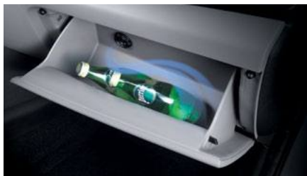
תא כפפות עם קירור