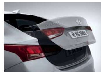
פתיחת תא מטען מהשלט