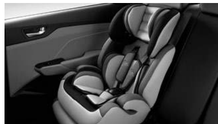
מנגנון עיגון מושב ילדים ISOFIX