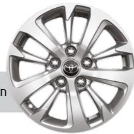
חישוקי סגסוגת קלה 16"