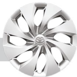
חישוקי פלדה 16"