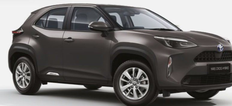
אפור כהה מטאלי 1G3