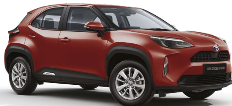
אדום מטאלי 3U5