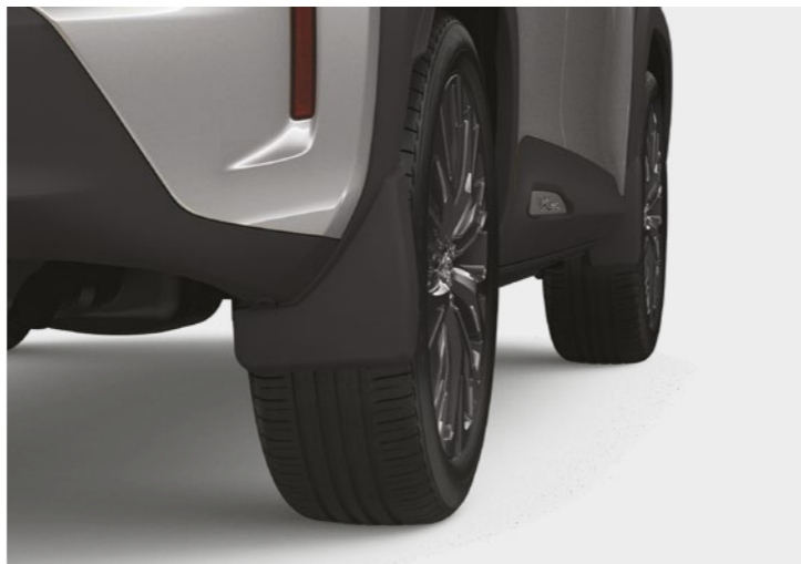
סט מגיני בוץ קדמיים ואחוריים, שיעזרו למזער כתמי מים ובוץ על הרכב