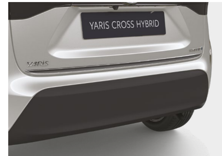
הוסיפו קישוט כרום המדגיש את עיצוב הפגוש האחורי ומבליט את המראה הייחודי של הרכב