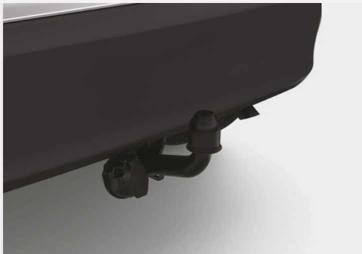
וו גרירה קבוע*