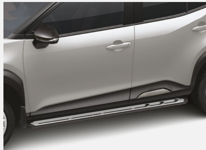
מדרגות צד המעצימות את המראה המחוספס של הרכב. שבנוסף מסייעות להגיע לגג הרכב בצורה קלה ופשוטה יותר