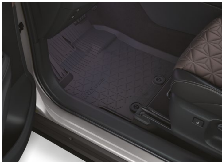
שטיחי גומי המגנים על פנים הרכב מפני לכלוך מבחוץ וניתנים להסרה לניקוי קל ופשוט