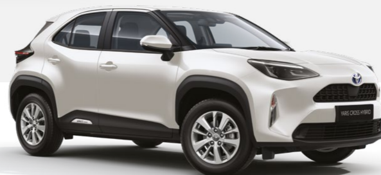
לבן פנינה מטאלי 089