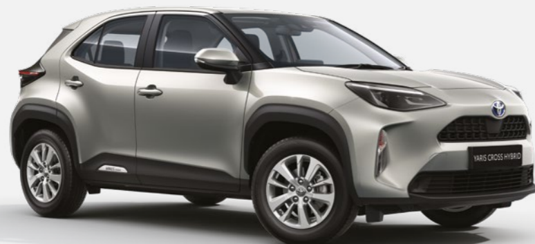
כסוף מטאלי 1L0