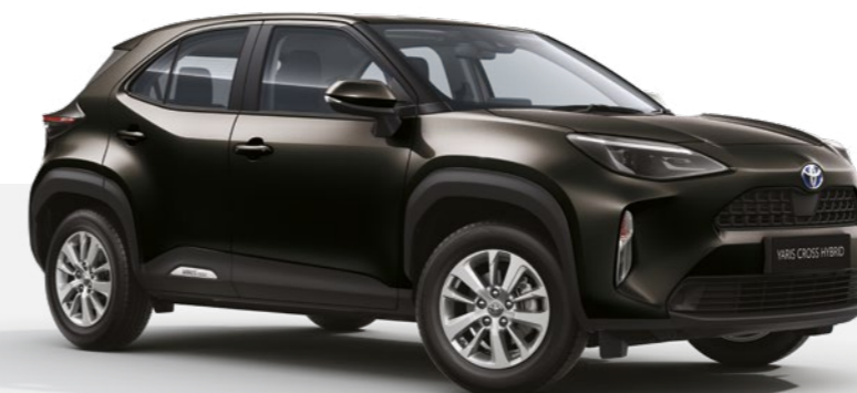
שחור מטאלי 209