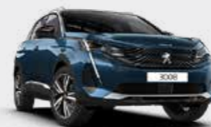
כחול בהיר מטאלי CELEBES BLUE | SYM0