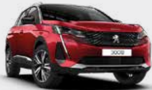
אדום מטאלי ULTIMATE RED | F3M5