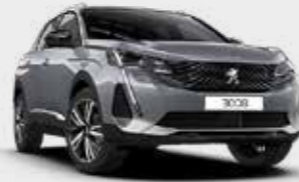
כסוף כהה מטאלי ARTENSE GREY | F4M0