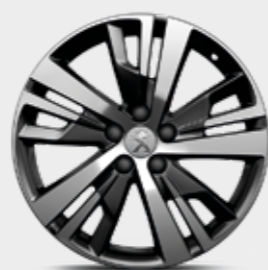
חישוקי סגסוגת 18" ACTIVE PACK בדגמי PREMIUM-I