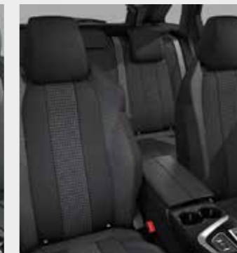
ACTIVE PACK ריפוד פנימי וגימור דלתות בצבע אפור כהה