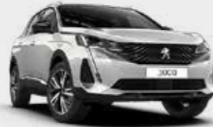
לבן פנינה מטאלי PEARLESCENT WHITE | N9M6