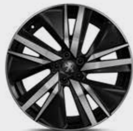
חישוקי סגסוגת 19" SAN FRANCISCO בדגמי GT

*צבע מטאלי בתוספת תשלום (למעט כחול בהיר)