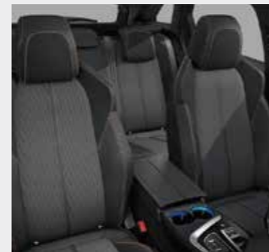
GT ריפוד פנימי כהה וגימור דלתות בשילוב אלקנטרה בגוון אפור בהיר