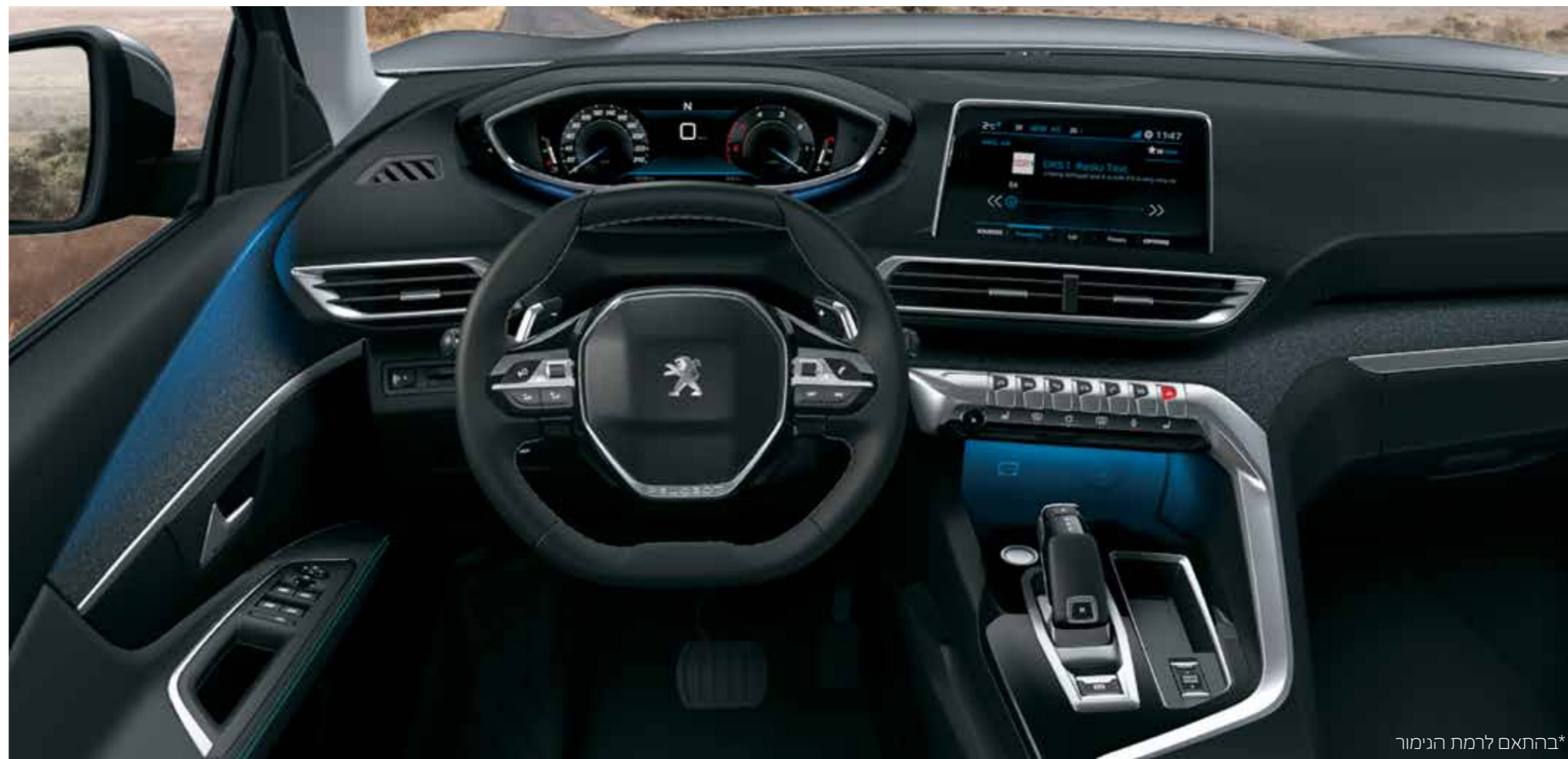
*בהתאם לרמת הנימור

הישאר מחובר על-ידי שיקוף של יישומי הסמארטפון המועדפים עליך על-גבי מסך המגע באמצעות Apple CarPlay.