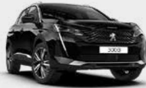
שחור מטאלי BLACK PERLA | 9VM0

לרשותך עומד מגוון רחב של צבעים שיאפשר לך להביע את עצמך באופן מלא.