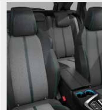
PREMIUM ריפוד פנימי וגימור דלתות בצבע אפור בהיר