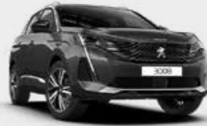
אפור כהה מטאלי PLATINIUM GREY | VLM0