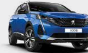
כחול פנינה מטאלי VERTIGO BLUE | SMM6

*צבע מטאלי בתוספת תשלום (למעט כחול בהיר)