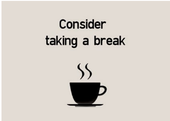
מערכת התראה על עייפות הנהג/ת (DAW) מערכת המזהה סימני עייפות אצל הנהג/ת, מתריאה על כך וממליצה על הפסקת התרעננות.