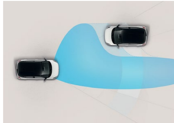
מערכת למעבר אוטומטי בין אור גבוה לנמוך (HBA) החלפה אוטומטית בין תאורת דרך לאור גבוה בהתאם לתנאי הדרך, מונעת סינוור רכבים ומגבירה את הבטיחות בנהיגת לילה.