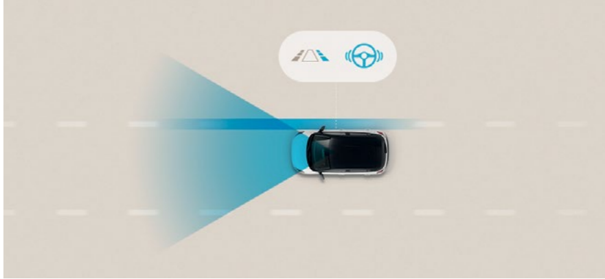
בקרת סטייה מנתיב + תיקון הגה (LKAS) סיוע אקטיבי בשמירה על נתיב הנסיעה, הכולל חייווי בלוח השעונים, התראה קולית ותיקון אקטיבי של נתיב הנסיעה.