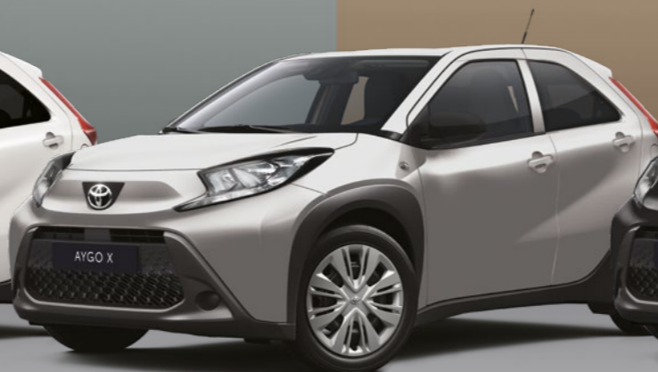
כסף מטאלי 1L0