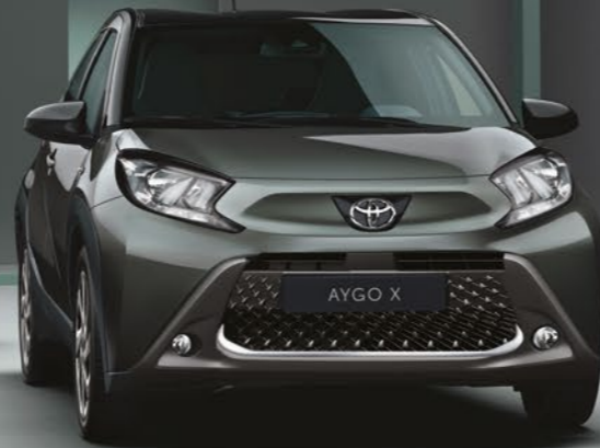
ירוק הל 2VK - 6W4/209