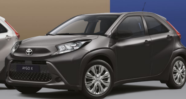
שחור מטאלי 209