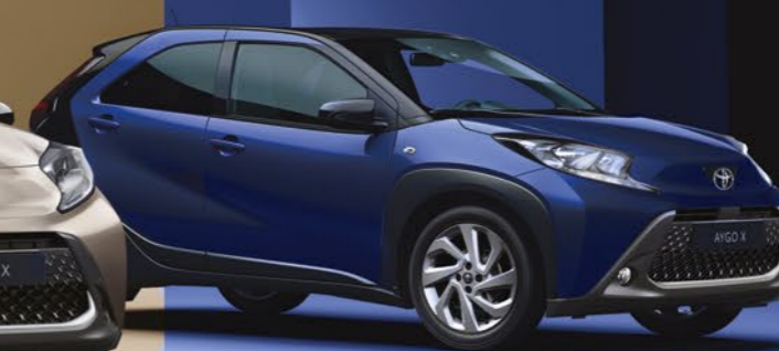
כחול ג'וניפר 2VL - 8Y8/209