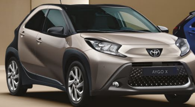
בז' ג'ינג'ר 2VJ - 4U9/209