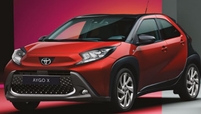
אדום צילי 2VH - 3U4/209