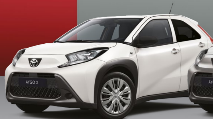
לבן צחור 040