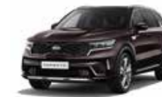
Essence Brown (BE2)