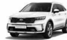
Snow Pearl White (SWP)