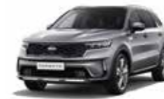
Steel Grey (KLG)