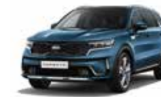
Mineral Blue (M4B)