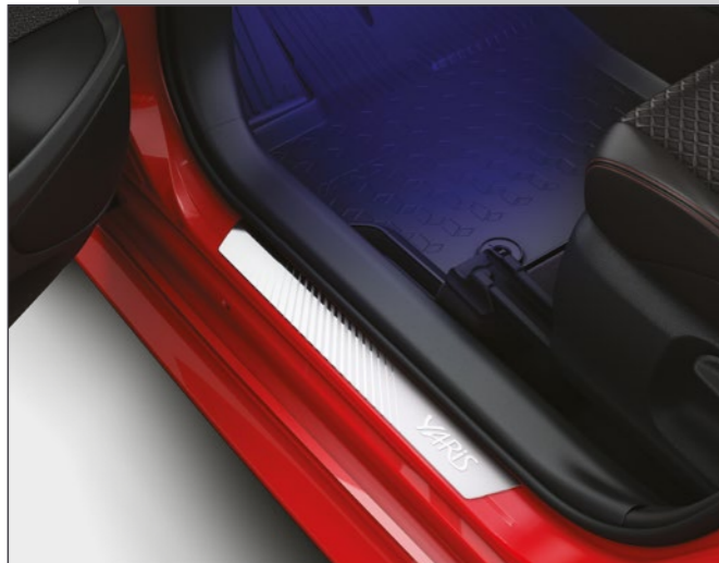
סט קישוטי סף קדמיים מקוריים היוצרים רושם מידי של סטייל, ובמקביל מגנים על סף הדלת מפני לכלוך ושריטות