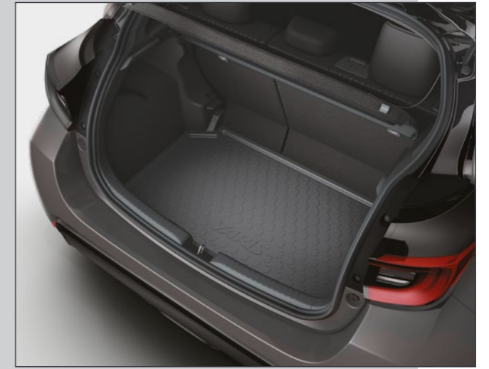
אמבטיה לתא המטען המספקת הגנה מפני לכלוך ומפני החלקה של ציוד וסחורה