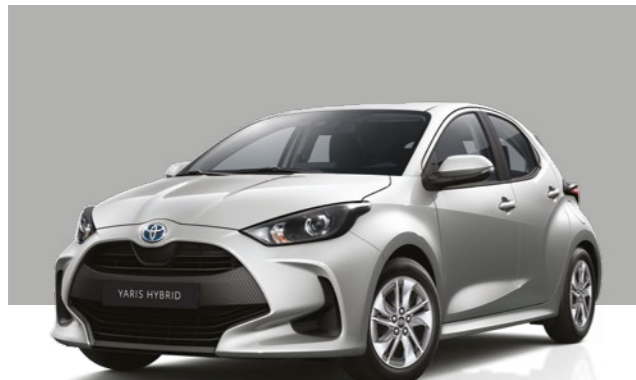
כסוף מטאלי 1L0