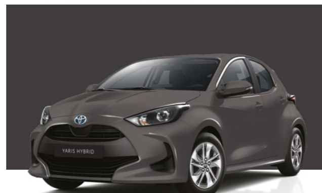
אפור מטאלי 1G3