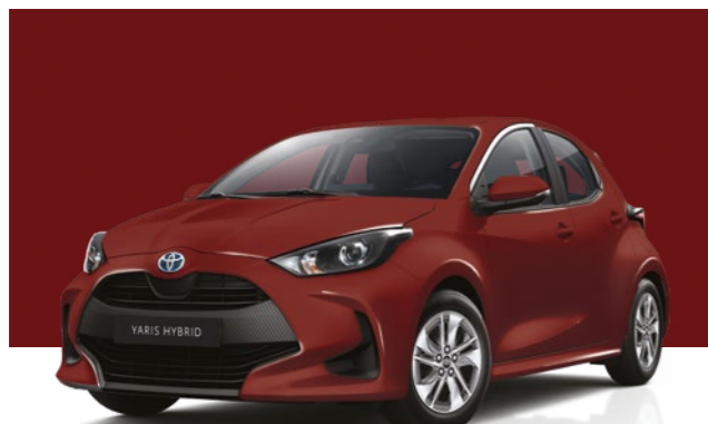
אדום רוז מטאלי 3U5