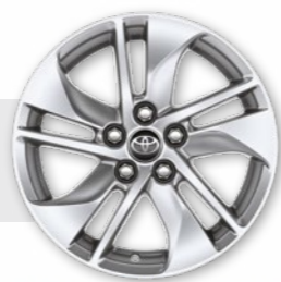
חישוקי סגסוגת קלה 15"