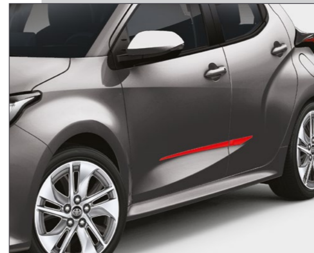
סט פסי קישוט בצבע אדום שייגרמו לראשים להסתובב בזכות נגיעת הצבע הנועזת שהם מוסיפים לרכב