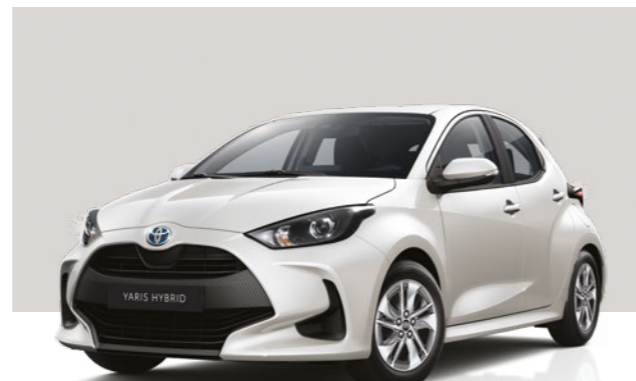
לבן פנינה מטאלי 089