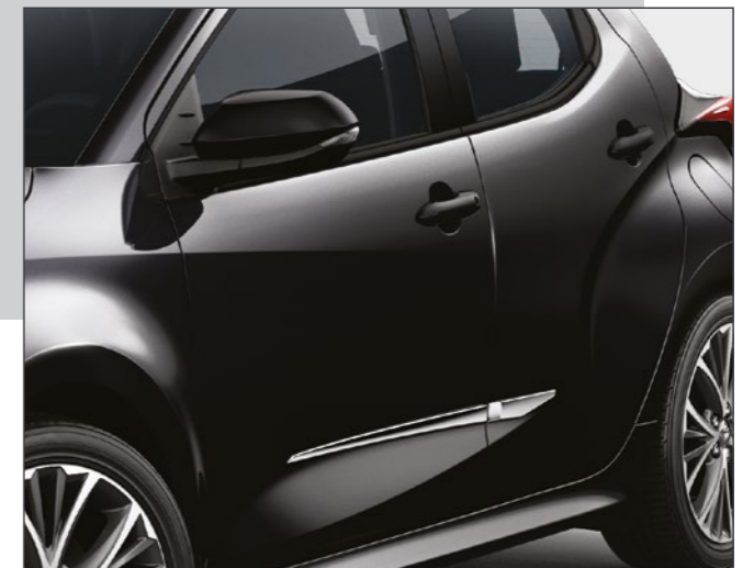
סט פסי קישוט בצבע כרום שייספקו ליאריס שלך מראה קלאסי בעל נגיעה אלגנטית