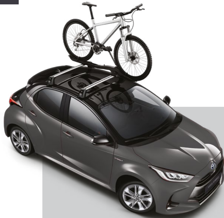
מוטות רוחב, עבור מגוון אביזרי גג ומתקני אופניים