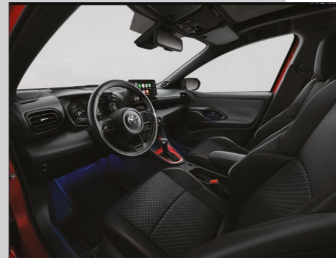
קישוט קונסולה מרכזית בצבע אדום שיהפוך את היאריס שלך לייחודית מבפנים כפי שהיא מבחוץ