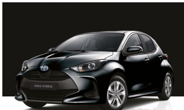
שחור מטאלי 209