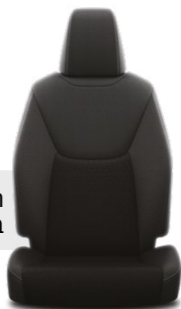
ריפודי בד בצבע שחור