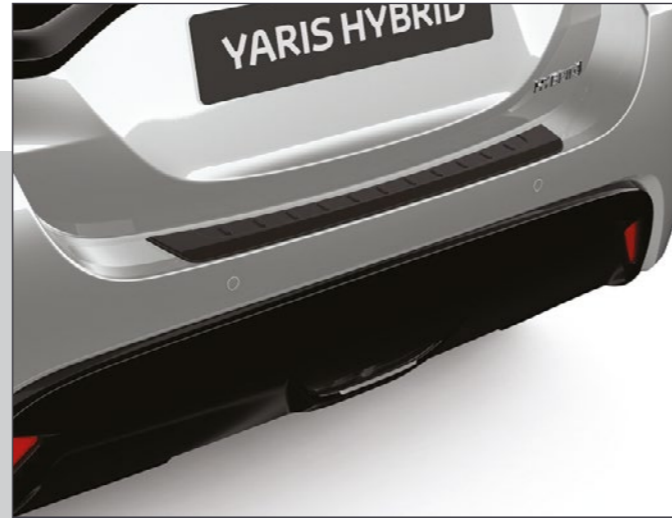
מגן פגוש אחורי המגן על הפגוש בעת טעינה ופריקה של סחורה מתא המטען