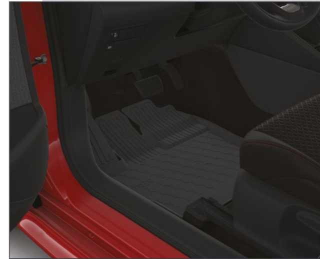
שטיחי גומי המגנים על פנים הרכב מפני לכלוך וניתנים להסרה ולניקוי פשוט