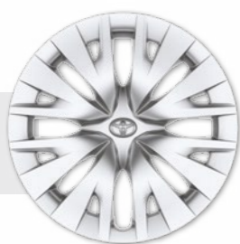
חישוקי פלדה 15"

*מומלץ לבדוק את תאימות הטלפון הנייד שברשותך למערכת ה-Bluetooth המותקנת ב-YARIS, אשר הינה מסוג: Toyota Touch 2. את הבדיקה ניתן לעשות בלינק הבא: www.toyota-tech.eu/bluetooth/search.aspx **נכון למועד פרסום קטלוג זה, אפליקציית Android Auto אינה זמינה בישראל.