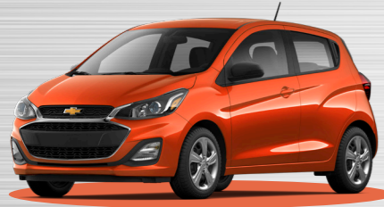
כתום שקיעה מטאלי - GFQ