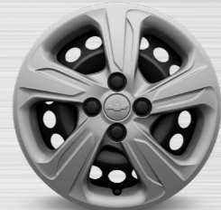
כיסוי גלגלים 15" (LT+)