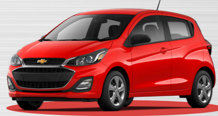
אדום להבה - GG2