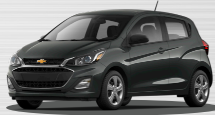
אפור כהה מטאלי - GK2