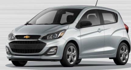
כסף מטאלי - GAN