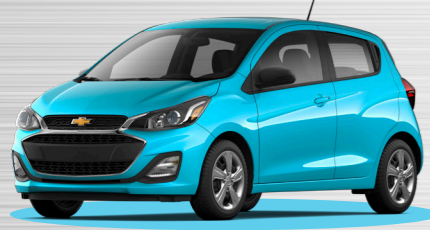
תכלת לגונה מטאלי - GNZ