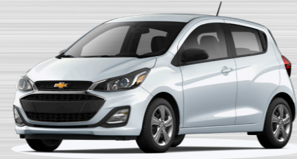
לבן פסגה - GAZ