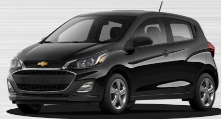
שחור מטאלי - GB0