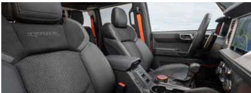
ריפוד עור שחור

* באמצעות טלפון נייד התומך ומאפשר זאת ובכפוף למגבלות שונות **פועל רק עם חלק מהמכשירים הניידים