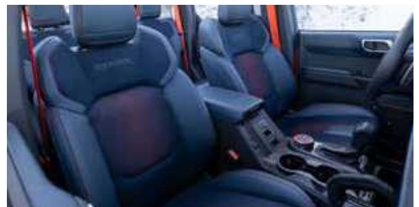
ריפוד עור כחול