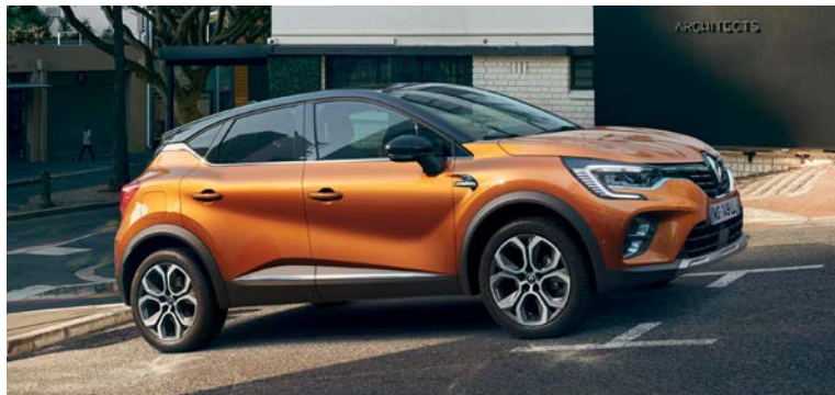
1.33 ל' טורבו בנדין אוט' LIGHT HYBRID EXECUTIVE / EDITION ONE