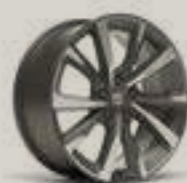
חישוק לאון FR מנוע 1.5