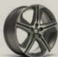
חישוק לאון FR מנוע 2.0