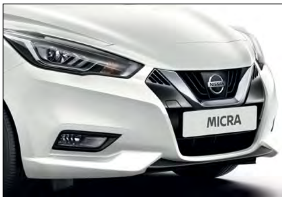
לבן פנינה מטאלי QNCK