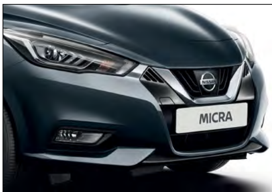
אפור כחול מטאלי APNK