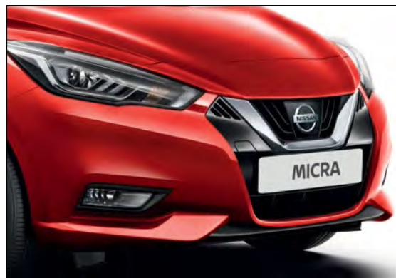
אדום שני מטאלי NBDK