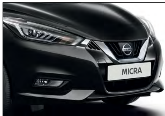
שחור מטאלי GNEK