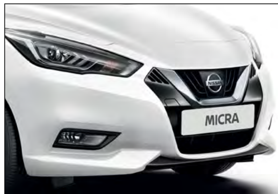
לבן צחור ZY2A