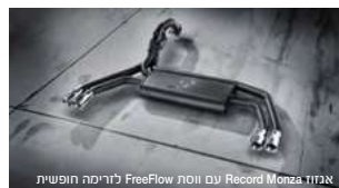
אנזוז Record Monza עם ויסות FreeFlow לזרימה חופשית