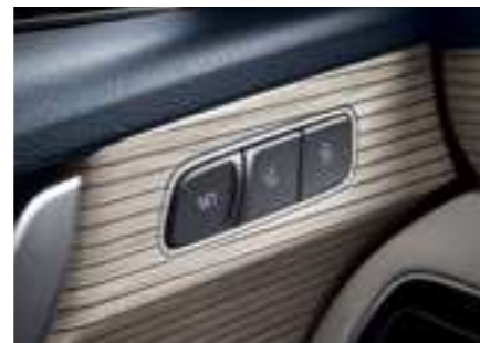
זכרונות למושב נהג*