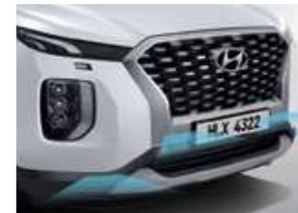
חיישני חניה קדמיים + אחוריים מקוריים