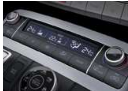
בקרת אקלים תלת איזורית