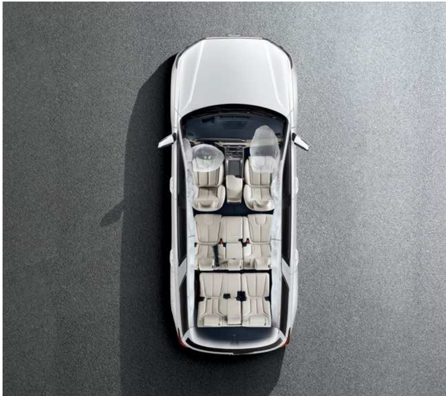
7 כריות אוויר

יונדאי פליסייד מצויד ב-Hyundai SmartSense, מערכות בטיחות מתקדמות המבוססות על טכנולוגיות הבטיחות האקטיבית העדכניות ביותר, כדי להעניק לכם יותר בטיחות ויותר שקט נפשי.