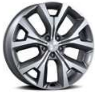
חישוק סגסוגת 20"