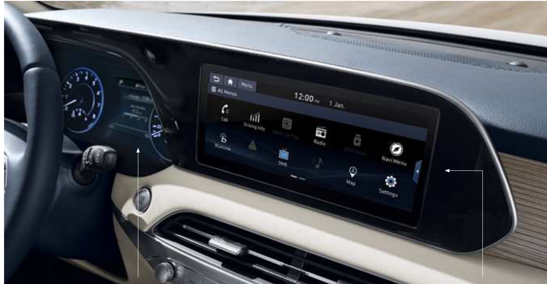
מחשב דרך צבעוני 7"