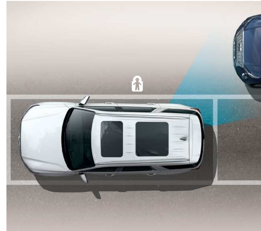
מערכת יציאה בטוחה מחנייה (SEA)

מערכת אקטיבית להתרעה ומניעת פגיעה ברכב חוצה בעת נסיעה לאחור.