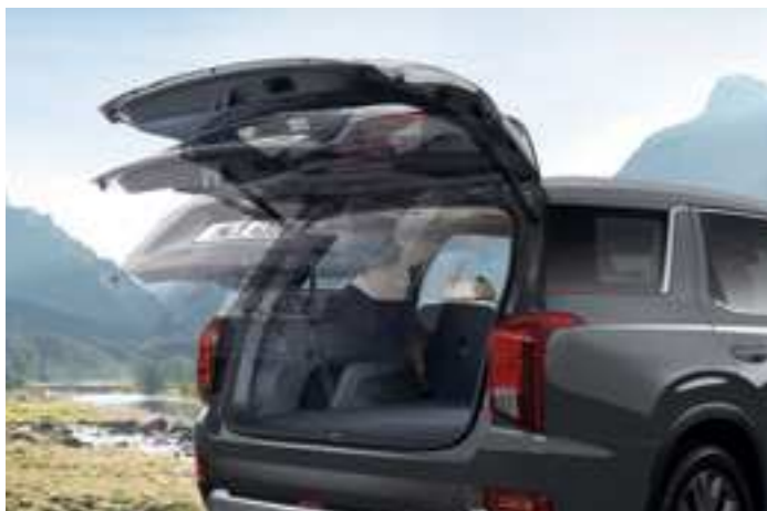
דלת תא מטען חשמלית חכמה

אם תעמדו ליד חלקו האחורי של הרכב למשך 3 שניות כאשר המפתח החכם נמצא אצלכם, דלת תא המטען תיפתח אוטומטית, כדי לאפשר לכם להוציא חפצים מהרכב בקלות ובנוחות. תוכלו לכוון את הגובה המקסימלי שבו דלת תא המטען תיפתח על ידי כוונת דלת תא המטען לגובה הרצוי ולחיצה על לחצן הסגירה והחזקתו לחוץ לפרק זמן מסוים.