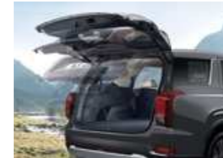
דלת תא מטען חשמלית חכמה