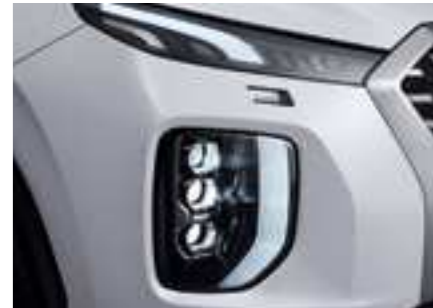
פנסים ראשיים מסוג LED