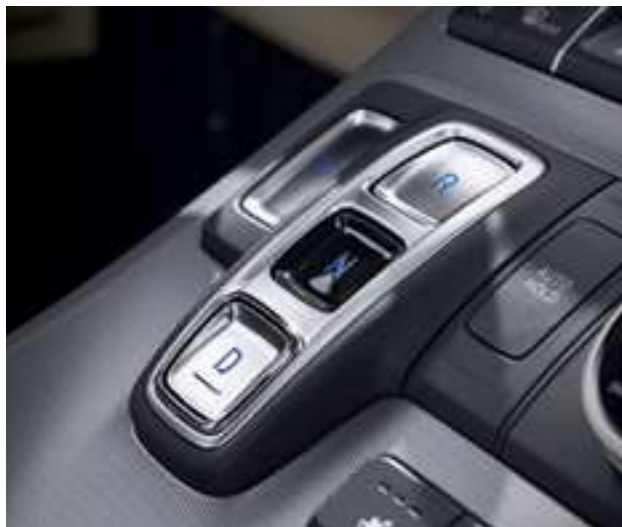
בחירת הילוך נסיעה בלחיצת כפתור (SBW)