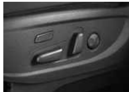
מושב נהג חשמלי