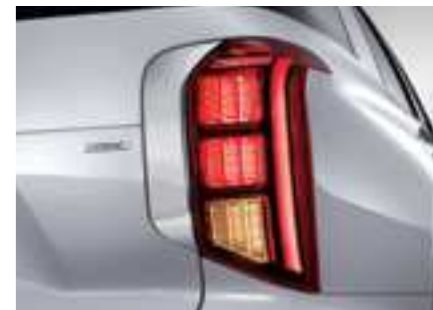
פנסים אחוריים LED