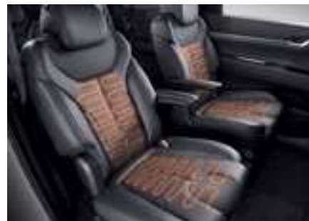
חימום מושבים קדמיים ואחוריים