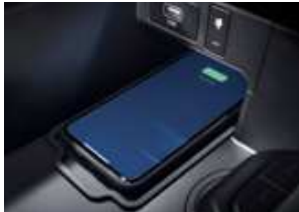
משטח טעינה אלחוטי