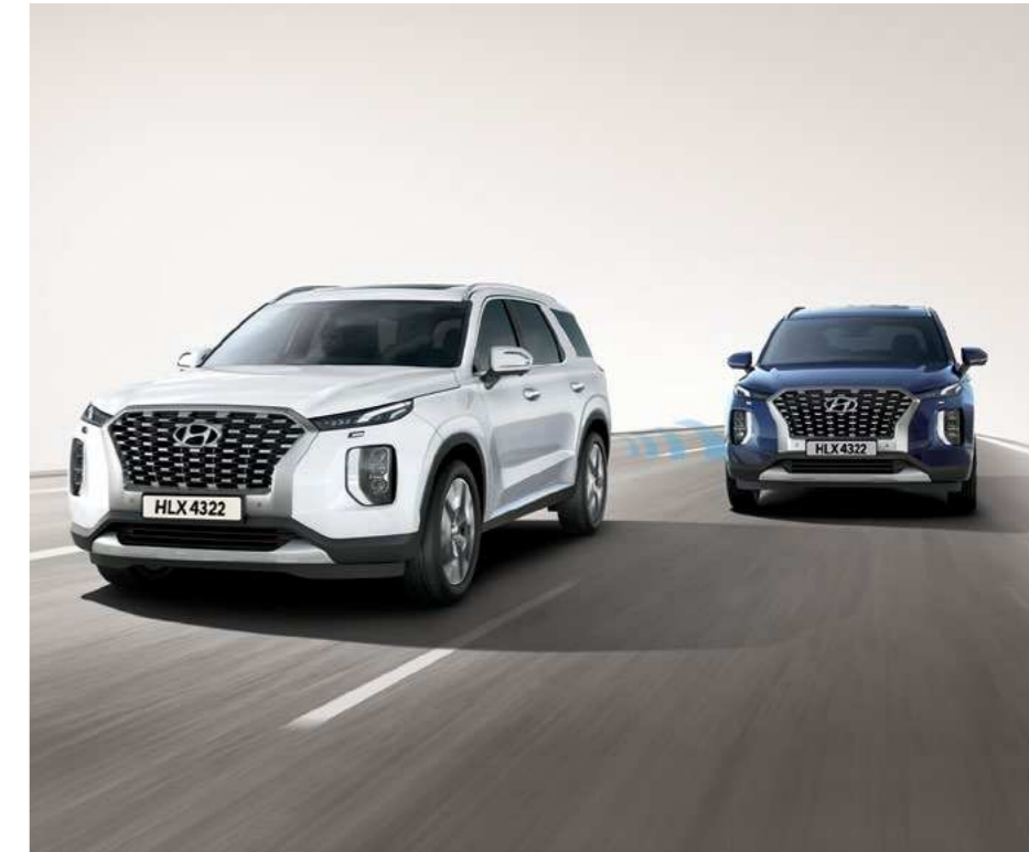
מערכת אקטיבית לזיהוי ומניעת התנגשות בכלי רכב ב"שטח מת" (BCA)

מערכת "יציאה בטוחה" המתריעה ומונעת פתיחת דלתות המושב האחורי במקרה של רכב חוצה.