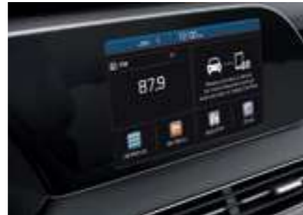
מערכת מולטימדיה עם מסך בגודל 8"