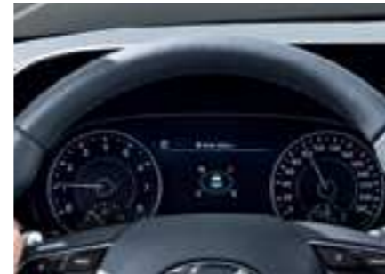
מסך TFT LCD בגודל 7"