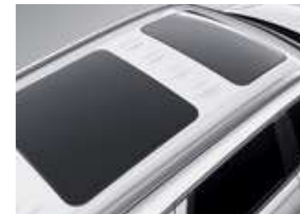
גג שמש פנורמי נפתח כפול*