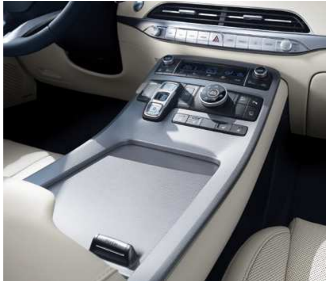
קונסולה גבוהה צפה

אם תעמדו ליד חלקו האחורי של הרכב למשך 3 שניות כאשר המפתח החכם נמצא אצלכם, דלת תא המטען תיפתח אוטומטית, כדי לאפשר לכם להוציא חפצים מהרכב בקלות ובנוחות. תוכלו לכוון את הגובה המקסימלי שבו דלת תא המטען תיפתח על ידי כוונת דלת תא המטען לגובה הרצוי ולחיצה על לחצן הסגירה והחזקתו לחוץ לפרק זמן מסוים.