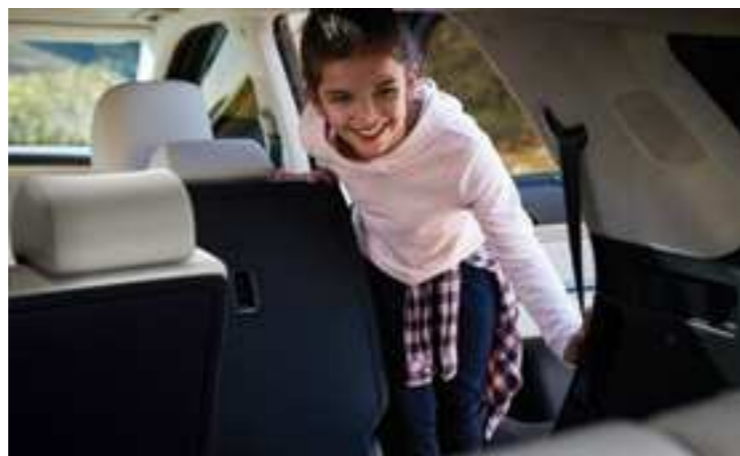
לחצן לקיפול המושבים לכניסה נוחה