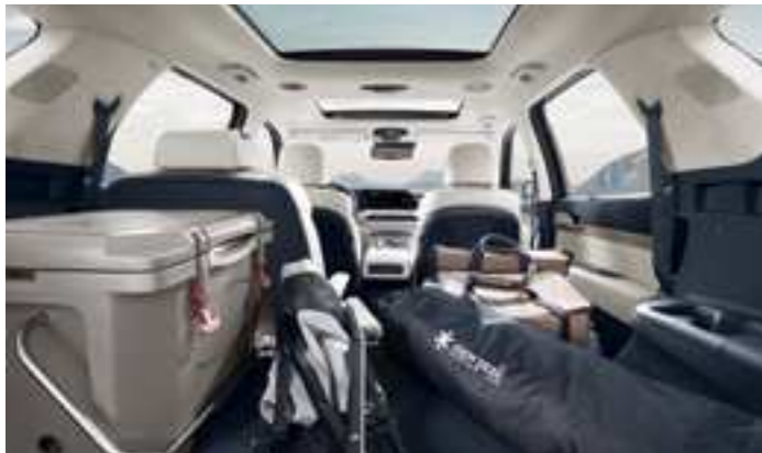
תא מטען מרווח (בקיפול מושבי השורה השלישית)