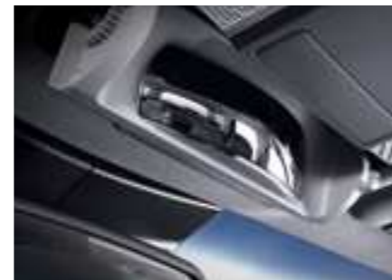
מראה פנורמית לפני הרכב