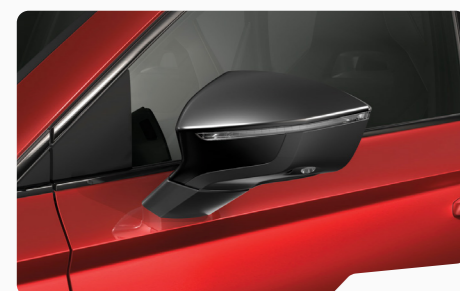
אדום מטאלי K1K1