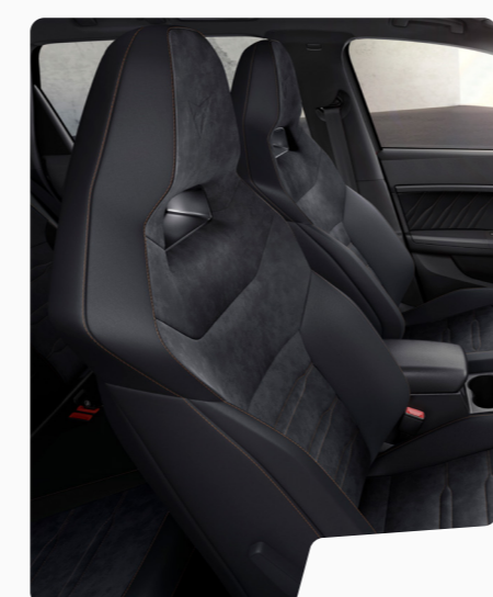
מושב באקט אלקנטרה