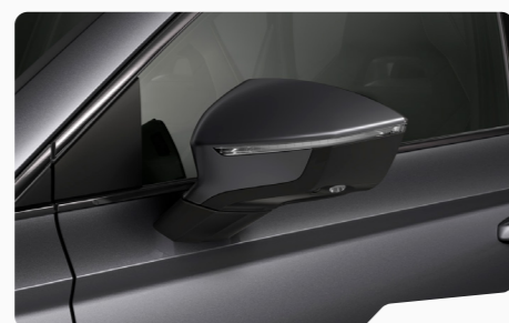
אפור גרפיט 5X5X