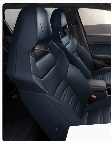
מושב באקט עור כחול