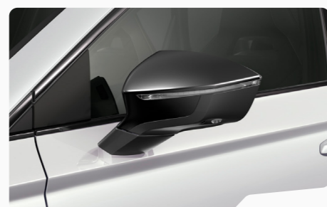
כבן נבדה 2Y2Y