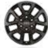
חישוקי סגסוגת קלה 18" בצבע שחור דגם SAHARA