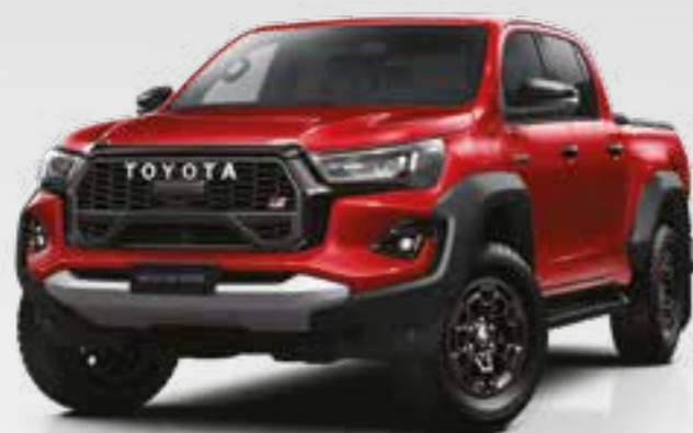
אדום עז 3U5**