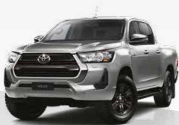
כסוף מטאלי 106