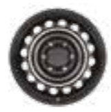
חישוקי פלדה 17" דגמי ACTIVE