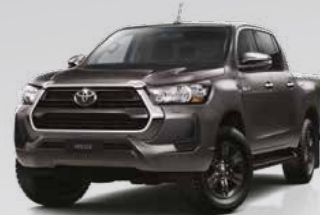
אפור כהה מטאלי 163