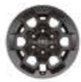
חישוקי סגסוגת קלה 17" בצבע שחור דגם GR SPORT

*נדלקת עם התנעת הרכב כל עוד פנסי הרכב אינם דולקים