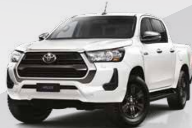
לבן פינה מטאלי 089