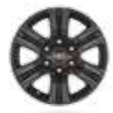
חישוקי סגסוגת קלה 17" בצבע שחור דגמי ACTIVE+, ADVENTURE