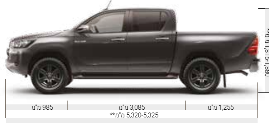
מ"מ 985 | מ"מ 3,085 | מ"מ 1,255 **מ"מ 5,320-5,325