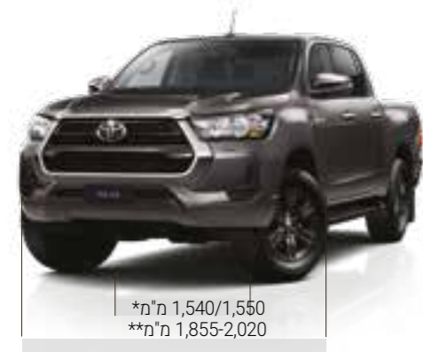
*מ"מ 1,540/1,550 **מ"מ 1,855-2,020