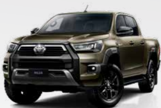
ברונזה מוזהב מטאלי 1X6*