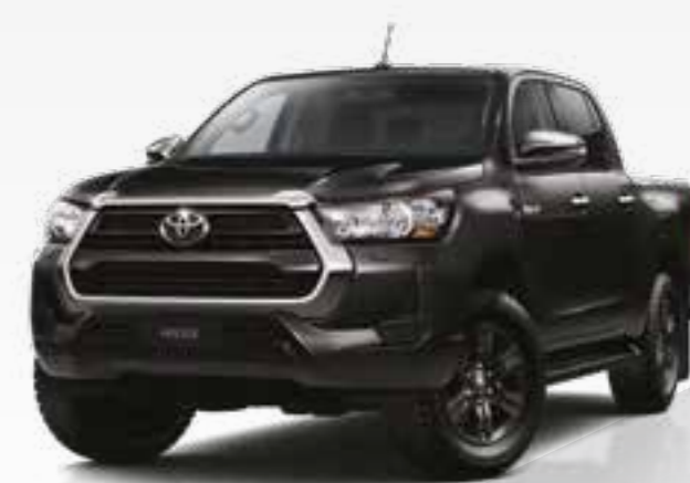
שחור מיקה מטאלי *218