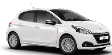
לבן בנקיז WPP0