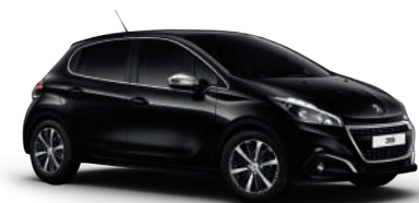
שחור פרלה 9VM0