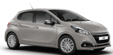
אפור אלומיניום ZRM0