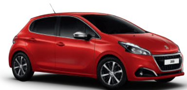
אדום רובי PYM0