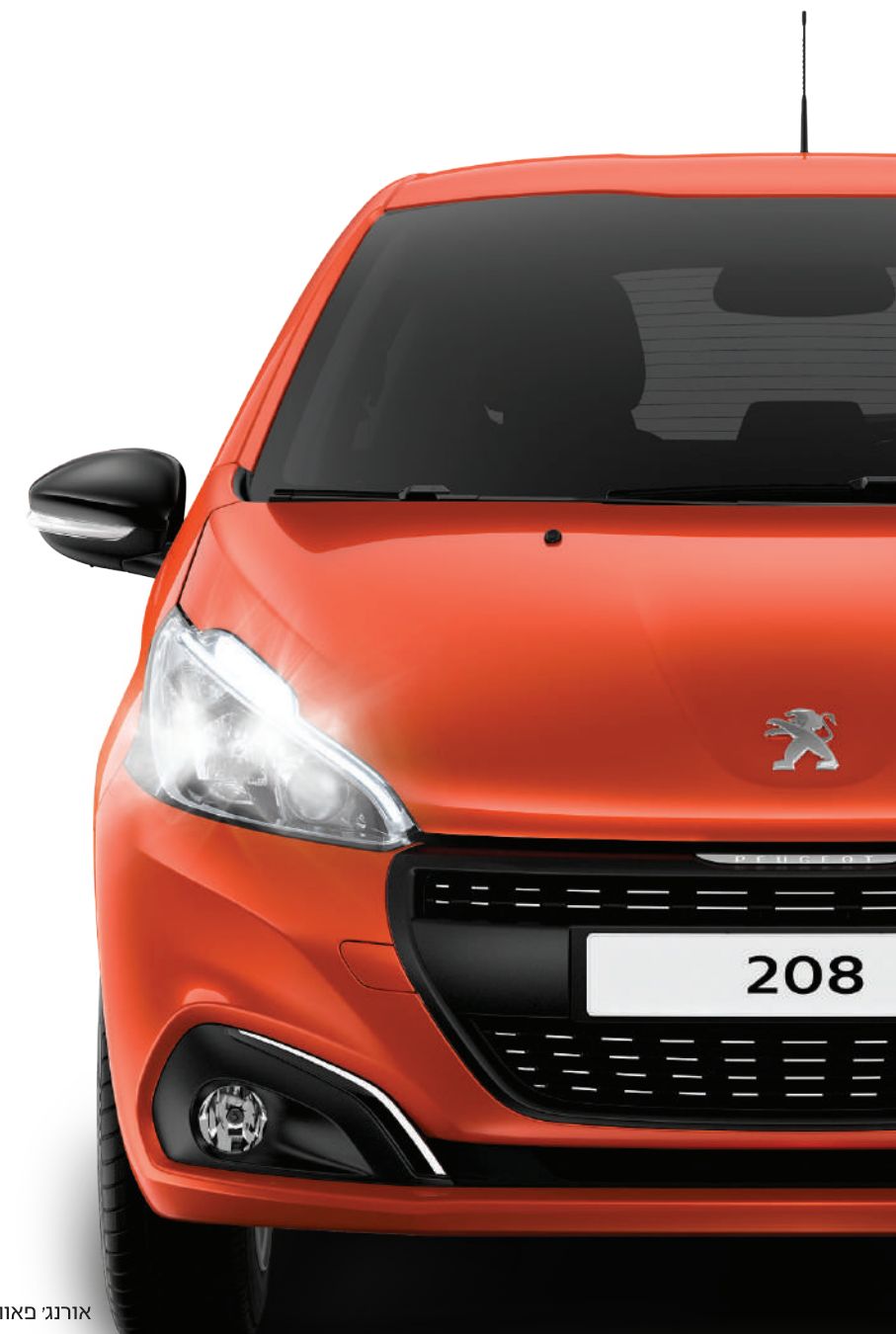
אורנג' פאוור 4TM0