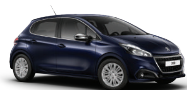
כחול אוקר 4UM0