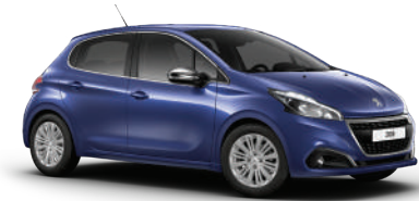
כחול וירטואל 4M0A