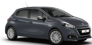
אפור שרק 9PM0