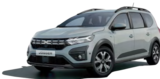
כסף מטאלי (KQF)