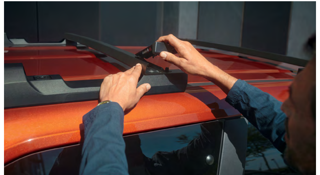
קורות גג מודולריות