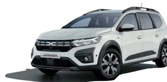
לבן קרח (369)