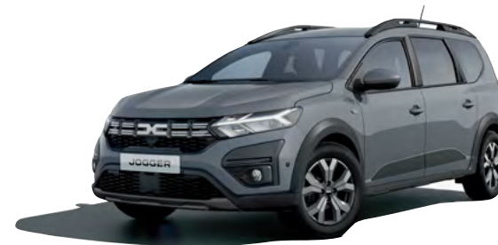
אפור אורבני מט מיוחד (KPW)