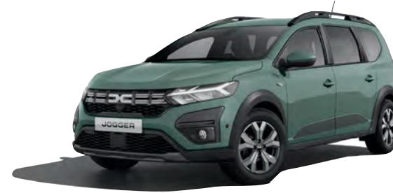
ירוק חאקי מט מיוחד (KQM)