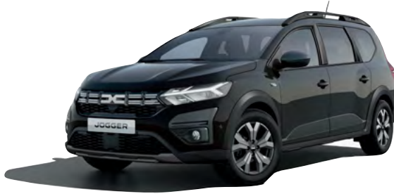
שחור פנינה מטאלי (676)