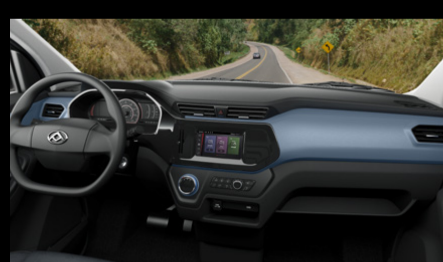
מערכת מולטימדיה מתקדמת וסביבת נהג מפנקת