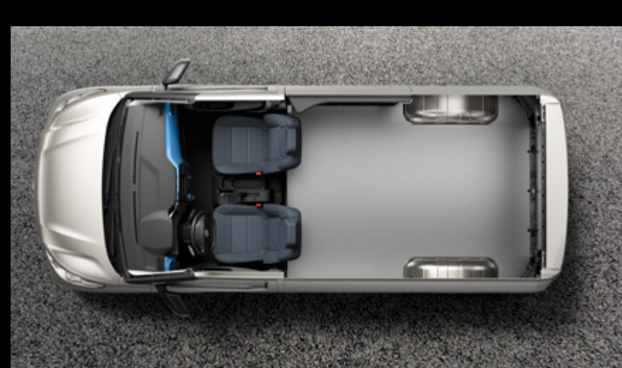
חמי מטרען ענק עד 6300 ל" (מתייחס לדגם הארוך - LWB)