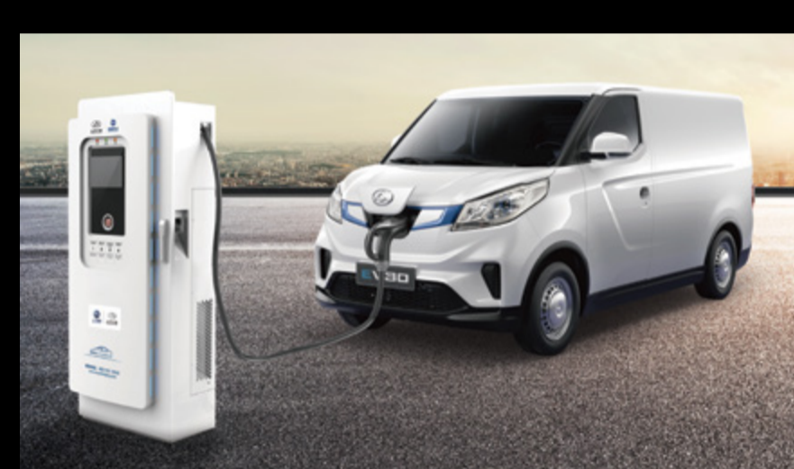
מגוון אפשרויות טעינה