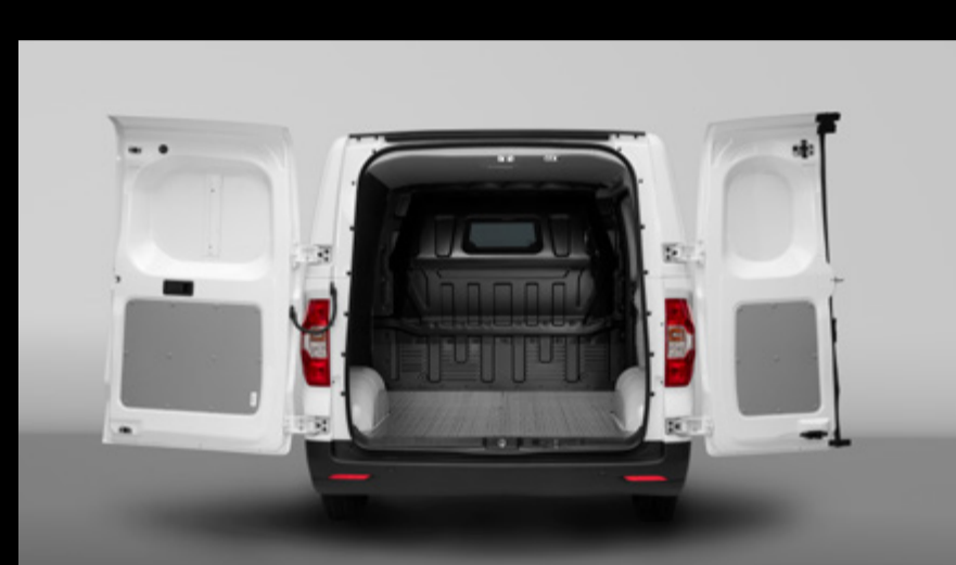
נחיות בהקמסת סחורות