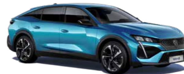
כחול בהיר מטאלי OBSESSION BLUE