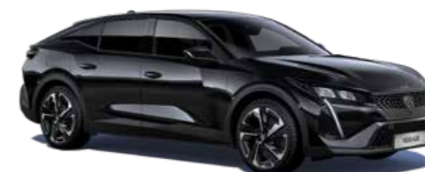
שחור מטאלי PERLA NERA BLACK