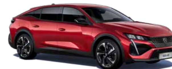
אדום מטאלי ELIXIR RED