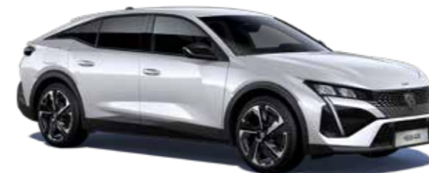
לבן פנינה מטאלי PEARLESCENT WHITE