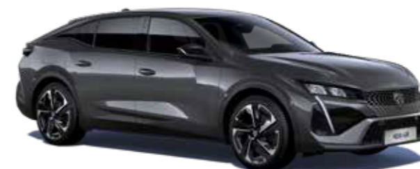
אפור כהה מטאלי TITANE GREY