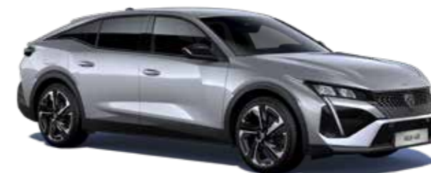
כסוף כהה מטאלי ARTENSE GREY