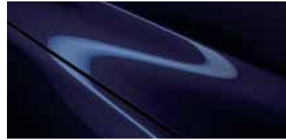
כחול קריסטל כהה (42M)