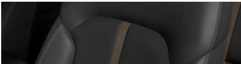
ריפודי עור Nappa בגוון שחור