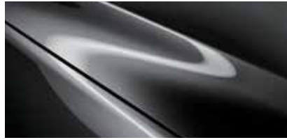
אפור עשיר (46G)*