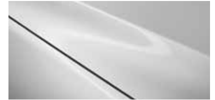
לבן עשיר (51K)*