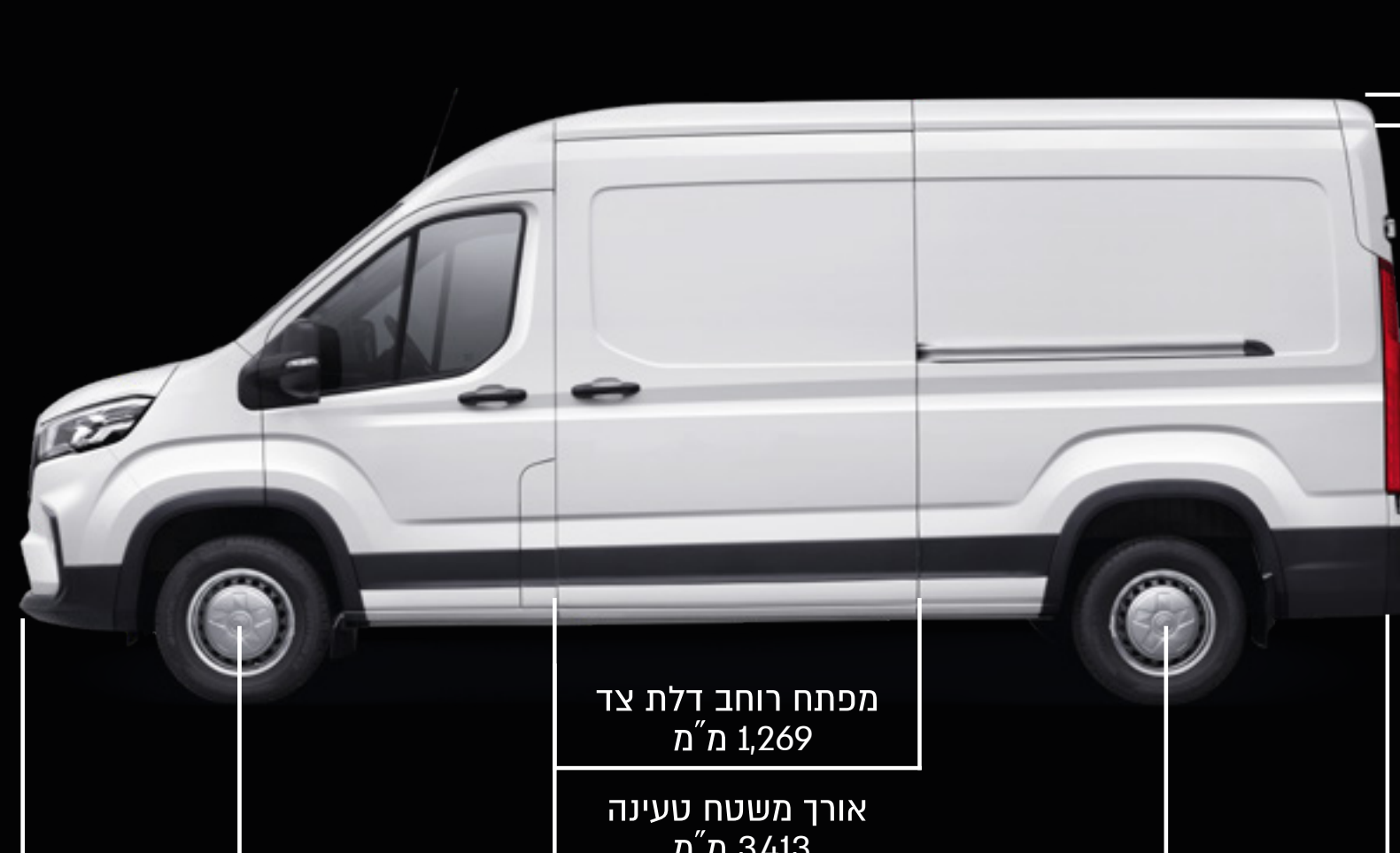
מפתח רוחב דלת צד 1,269 מ"מ אורך משטח טעינה 3,413 מ"מ בסיס לגלגלי 3,760 מ"מ