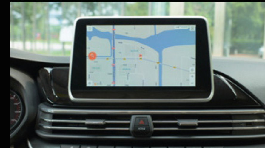
מערכת מולימדיה מתקדמת ונוחה לשימוש