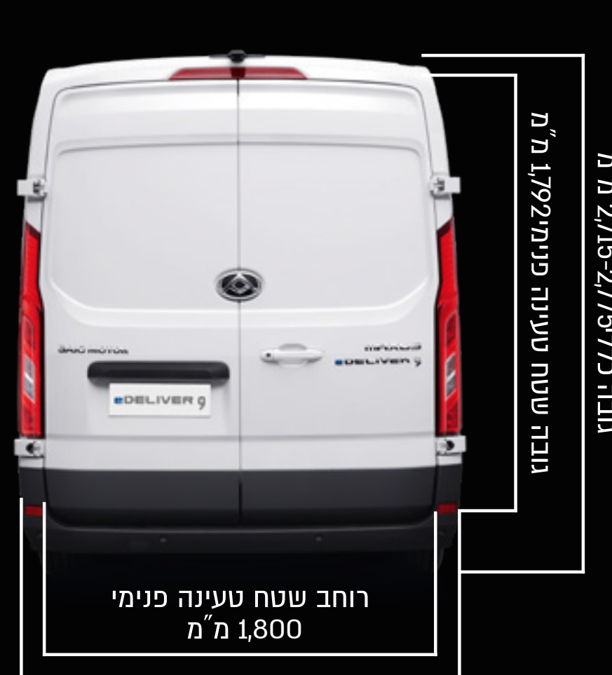
רוחב כולל 2,062 מ"מ רוחב שטח טעינה פנימי 1,800 מ"מ

** ייתכן פער בין צריכת החשמל בנתאי מעבדה לבין צריכת החשמל בפועל ט.ל.ח.