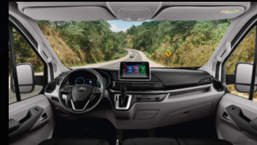
סביבת נהג מרווחת ומפנקת