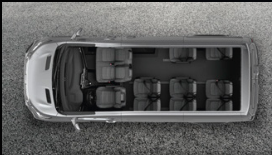
מגוון אפשרויות דיגום להובלה והיסעים