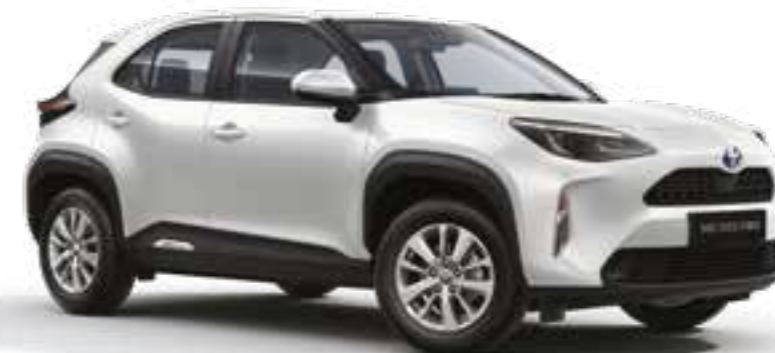
לבן צחור 040