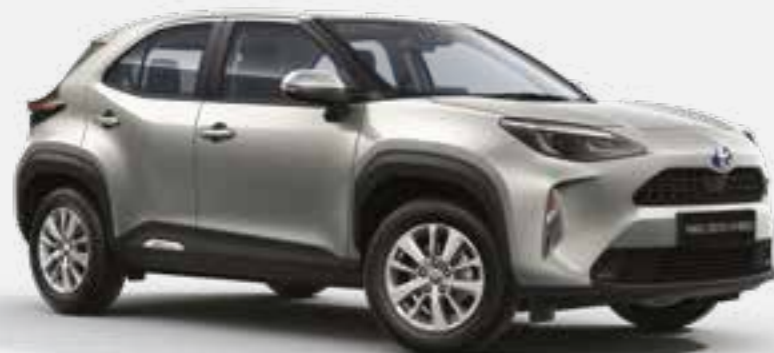
כסוף מטאלי 1L0