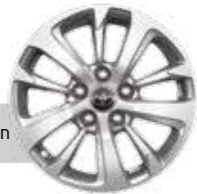
חישוקי סגסוגת קלה 16"