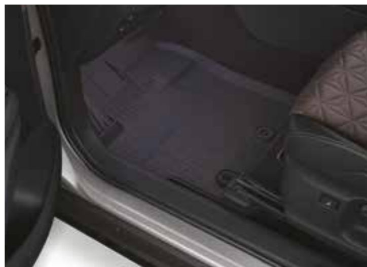
שטיחי גומי המגנים על פנים הרכב מפני לכלוך מבחוץ וניתנים להסרה לניקוי קל ופשוט