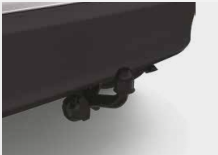
וו גרירה קבוע*