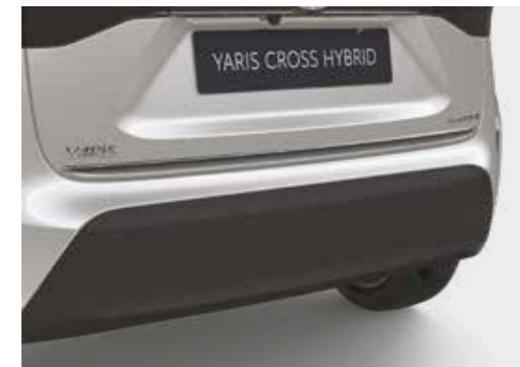
הוסיפו קישוט כרום המדגיש את עיצוב הפגוש האחורי ומבליט את המראה הייחודי של הרכב