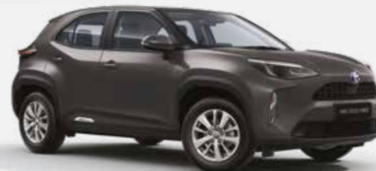
אפור כהה מטאלי 1G3