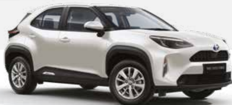
לבן פנינה מטאלי 089