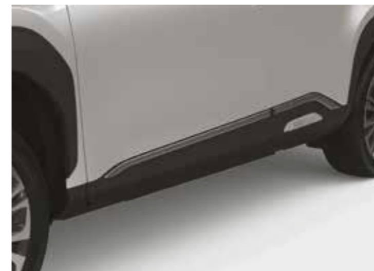
הוסיפו פס קישוט כרום לדלתות, והעניקו לרכב מראה עוצמתי לנגיעה נוספת של סטייל המותאם למראה של העיר