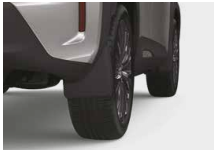
סט מגיני בוץ קדמיים ואחוריים, שיעזרו למזער כתמי מים ובוץ על הרכב