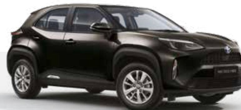
שחור מטאלי 209