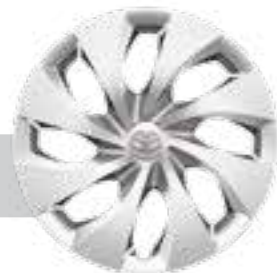
חישוקי פלדה 16"