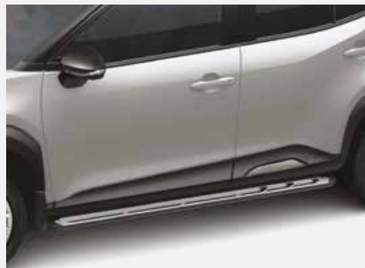
מדרגות צד המעצימות את המראה המחוספס של הרכב. שבנוסף מסייעות להגיע לגג הרכב בצורה קלה ופשוטה יותר