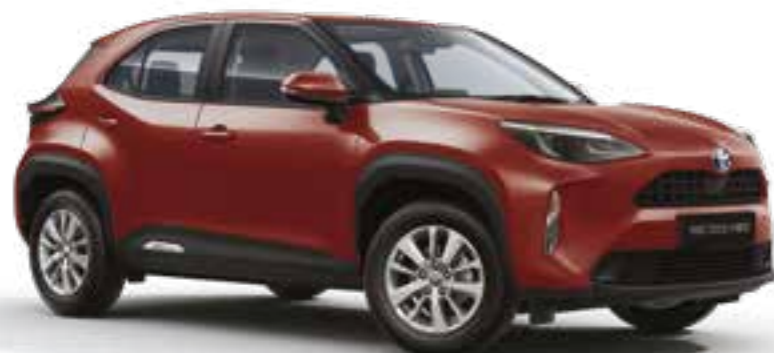
אדום מטאלי 3U5