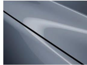
כחול מתכתי (47C)