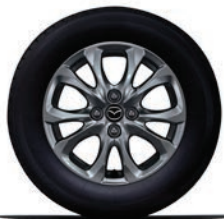
חישוקי סגסוגת 15"