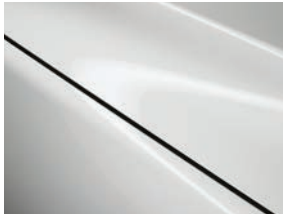
לבן פנינה (25D)