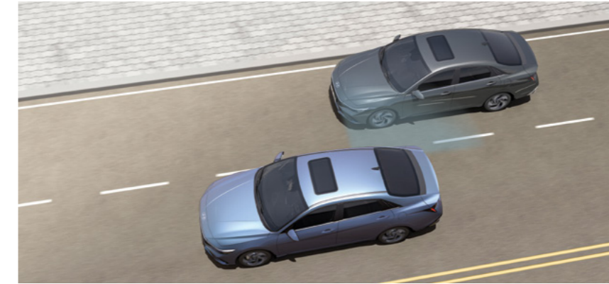
מערכת אקטיבית לזיהוי ומניעת התנגשות בכלי רכב ב"שטח מת" (BCA)* מערכת מבוססת רדאר המתריעה על רכבים ב"שטח מת" בעת מעבר נתיב ומבצעת תיקון הגה אוטומטי במידה והנתיב אינו פנוי.