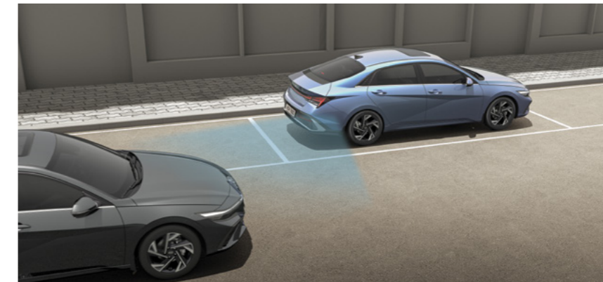
מערכת אקטיבית ליציאה בטוחה מהרכב (SEA)* מערכת "יציאה בטוחה" המתריעה ומונעת פתיחת דלתות המושב האחורי במקרה של רכב חוצה.