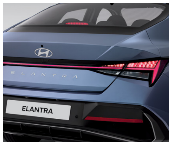
פנסים אחוריים מסוג LED