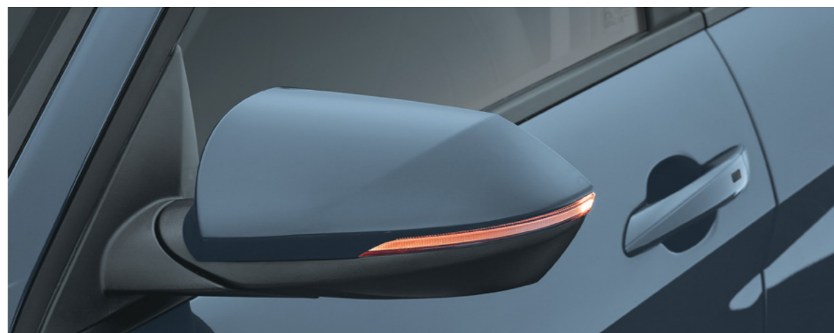
פנסי איתות במראות