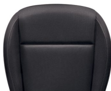
ריפודי בד - שחור