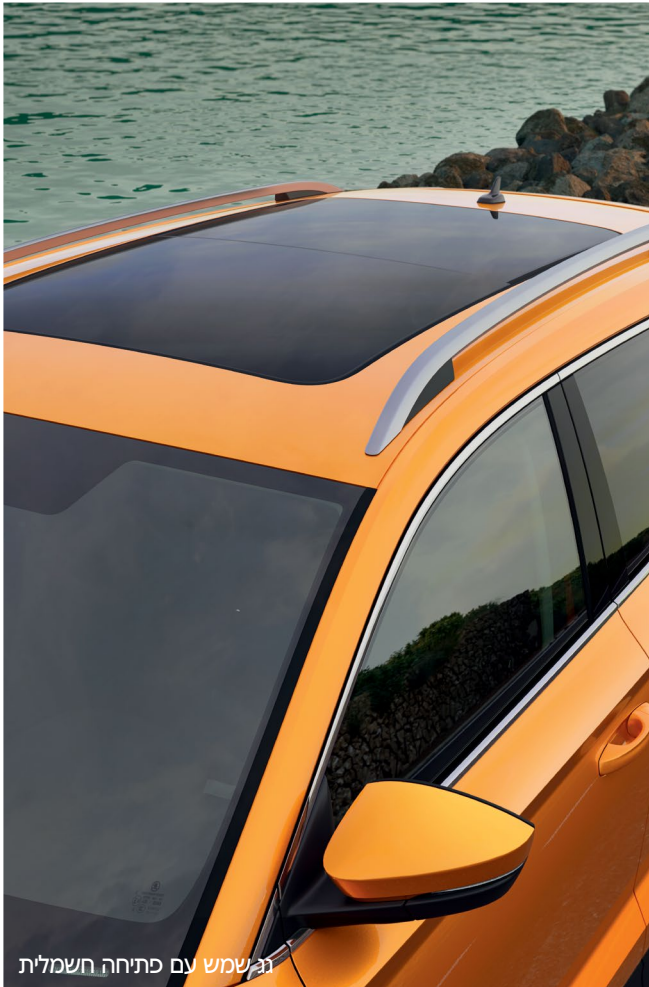
גג שמש עם פתיחה חשמלית