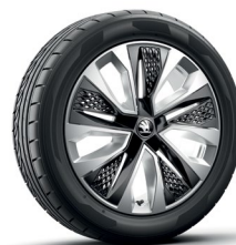
חישוקי סנסוגת PROCYON "18