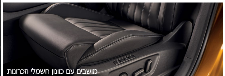
מושבים עם כוונן חשמלי וזכרונות