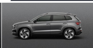
GRAPHITE GREY (5X)