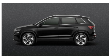
MAGIC BLACK (1Z)