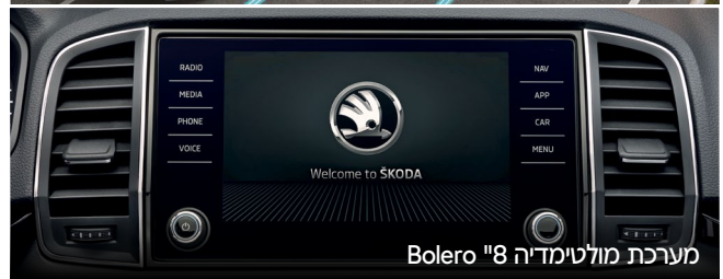
מערכת מולטימדיה "8 Bolero