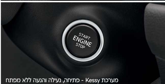
מערכת Kessy - פתיחה, נעילה והנעה ללא מפתח