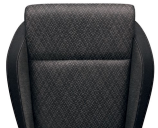
ריפודי בד - שחור