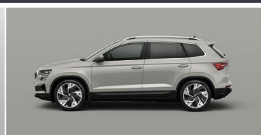
STEEL GREY (M3)