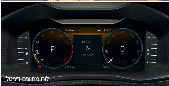
לוח מחוונים דיגיטלי