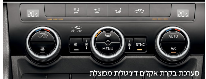
מערכת בקרת אקלים דיגיטלית מופעלת