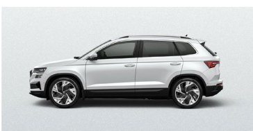
MOON WHITE (2Y)