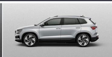
BRILLIANT SILVER (8E)