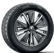
חישוקי סנסוגת "17 SCUTUS