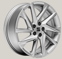
* זמין לרמת גימור FR מנוע 1.0L בלבד

ברוכים הבאים לרמת גימור שהיא סטנדרט בפני עצמה. מהמושבים המעוצבים, דרך חלון הגג הפנורמי ועד המראה הספורטיבי ומערכות הבטיחות המתקדמות - כל פרט ופרט נוצר ועוצב כדי לספק לכם חוויית נהיגה משודרגת.