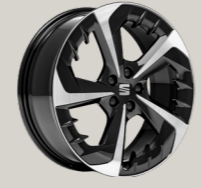
* זמין לרמת גימור FR מנוע 1.5L בלבד