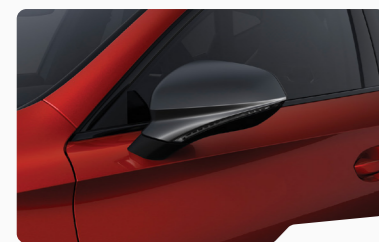
אדום כהה יין E1E1