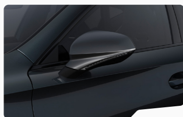
אפור מטאני S7S7