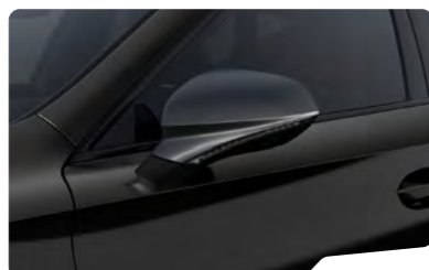
שחור מטאלי 0E0E