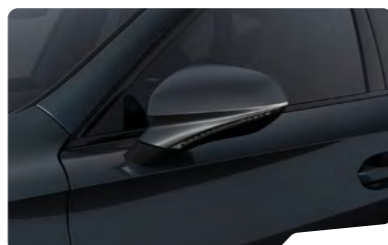
אפור מטאלי S7S7