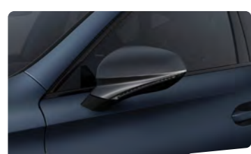
כחול מט Q4Q4