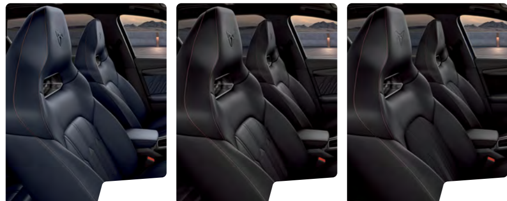
מושב באקט עור כחול