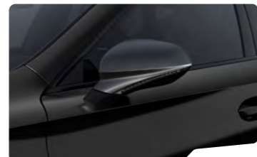
שחור מטאלי OE0E