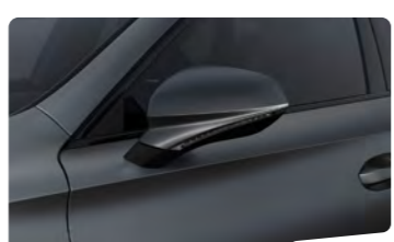
אפור מט R9R9