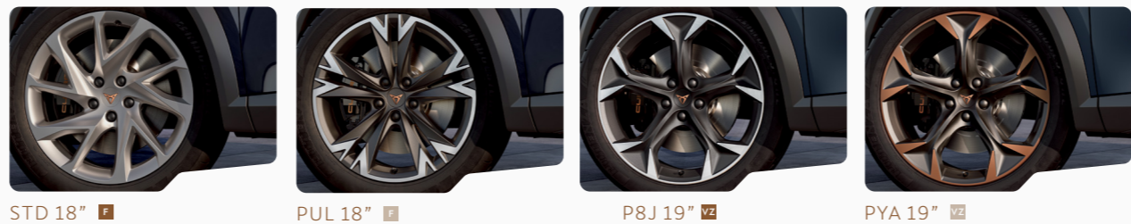
STD 18" 1