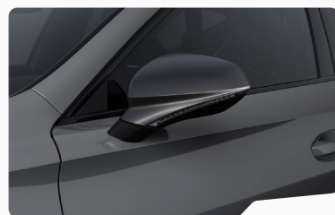
אפור גרפיט R6R6