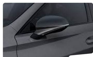
אפור גרפיט R6R6