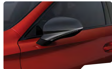
אדום כהה יין E1E1