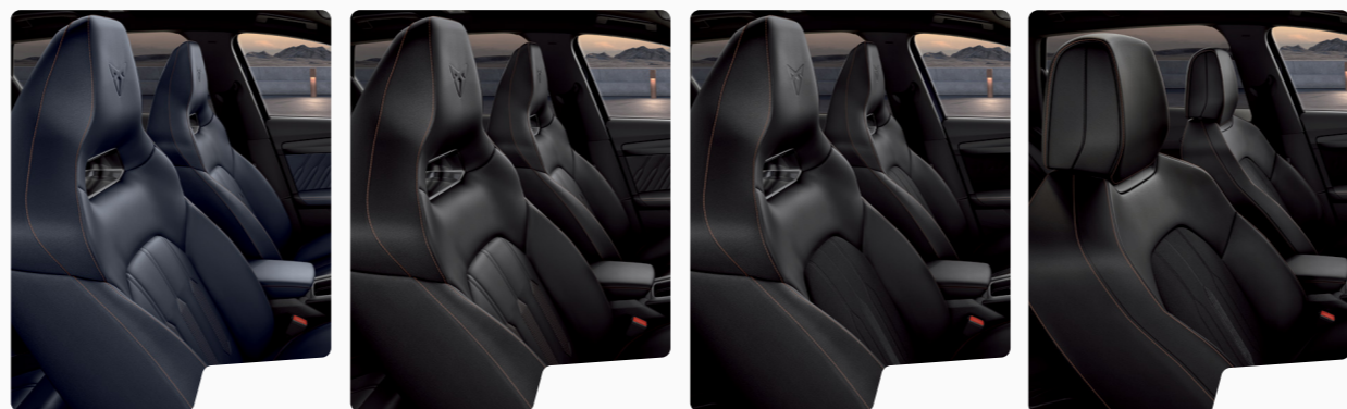
1 מושבי ספורט