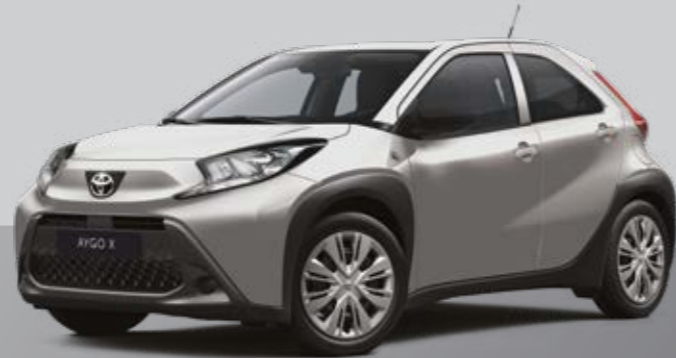
כסף מטאלי 1L0