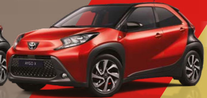
אדום צ'ילי / שחור 3U4/209 - 2VH