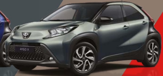
ירוק הל / שחור 6W4/209 - 2VK