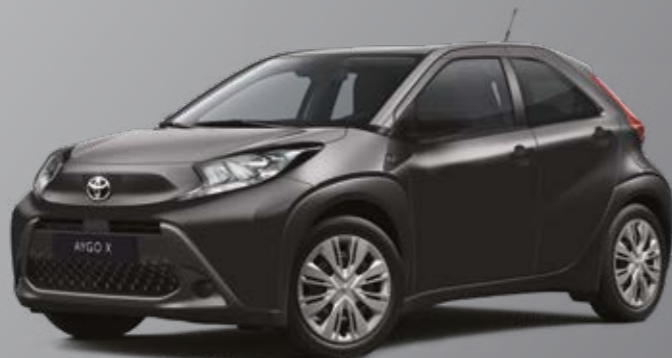
שחור מטאלי 209