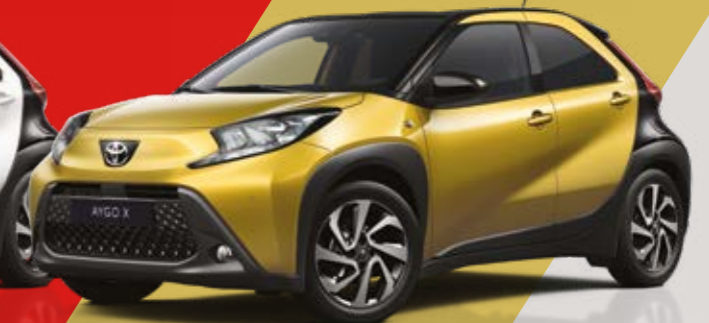
זהב / שחור 5C2/209 - 2TY