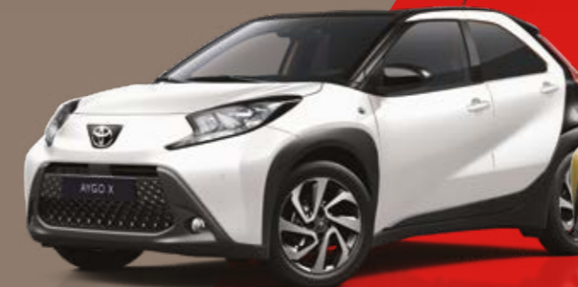
לבן צחור / גג שחור 040/209 - 2NR