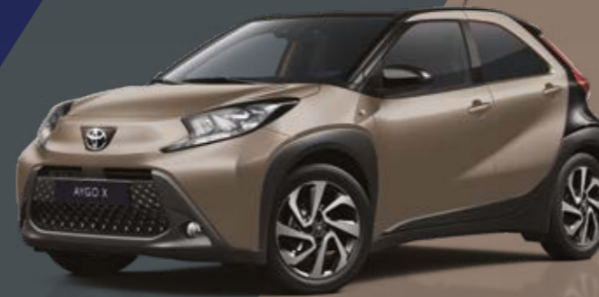
בז' ג'ינג'ר / שחור 4U9/209 - 2VJ