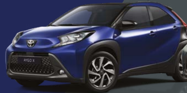
כחול ג'וניפר / שחור 8Y8/209 - 2VL