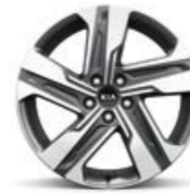
חישוקי 19 אינץ' בדגמי הייבריד EX, PREMIUM ופלאג אין

חישוקי סגסוגת הסורנטו זמין עם חישוקי סגסוגת אווירודינמיים וקלי משקל בקוטר 18 או 19 אינץ' המדגישים את אופיו השרירי והקשוח