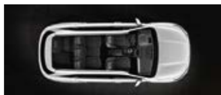
שורה שלישית מקופלת חלקית