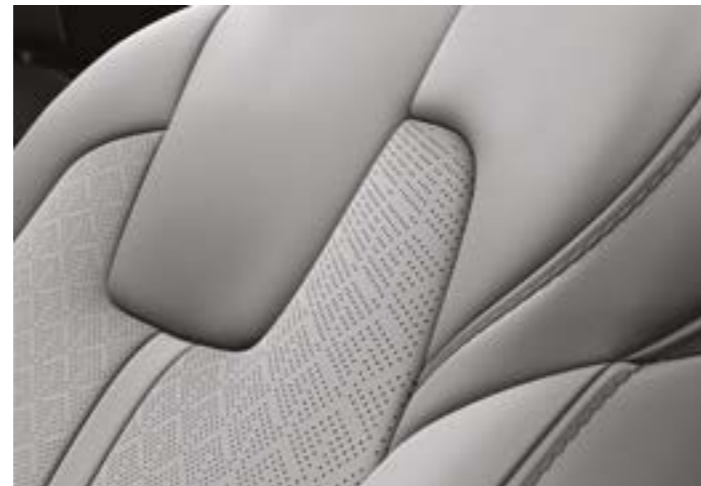
עור אפור בדגם EX/פלאג אין Premium