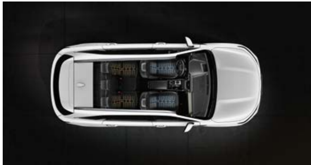
מושבים קדמיים עם חימום ואוורור* לימים חמים, מושב הנהג והנוסע כוללים חרירי אוורור בבסיס המושב ובמשענת הגב. לימים קרים, ניתן לחמם את הבסיס ומשענת הגב של המושב

חלוק את חוויית הנסיעה שלך יחד עם האנשים שאתה אוהב. הסורנטו החדש מעניק חוויה ייחודית לנהג ולשאר הנוסעים ברכב, הודות לתא הנוסעים המרווח, הנוח ובעל העיצוב הארגונומי.