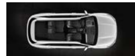
שורה שנייה מקופלת חלקית (5 מושבים)

הסורנטו מוכן היטב לכל משימה שתכננת ולכל מטען שתרצה לשאת.