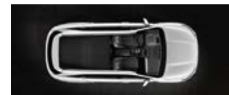
שורה שלישית מקופלת למצב שטוח לגמרי ושורה שנייה מקופלת חלקית