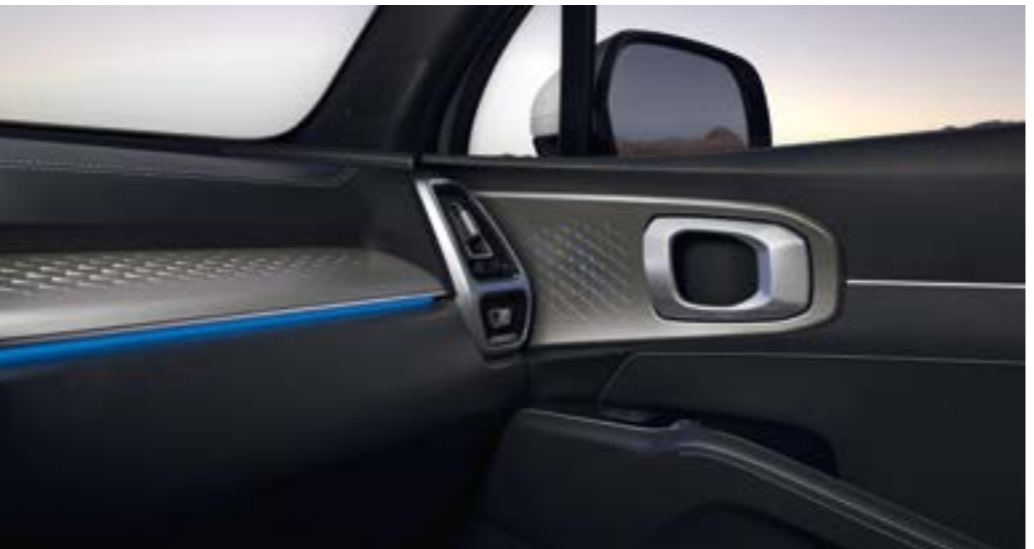
תאורת אווירה ליצירת האווירה המתאימה, הסורנטו החדש מצויד בפסי תאורה עם 7 גוונים לבחירה בדלתות הקדמיות ובחלקו התחתון של הדשבורד.