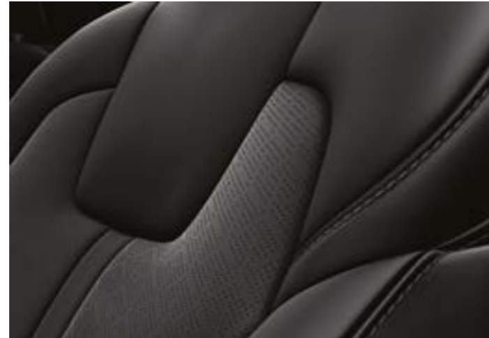
עור שחור בדגם EX/פלאג אין Premium

מושבי הבד השחורים מגיעים עם עיטורים באפקט מתכתי והטבעה תלת ממדית למראה ספורטיבי עוצמתי. בנוסף, תוכלו לבחור במושבי עור בגוון אפור רב רושם או במושבי עור שחורים הכוללים עיטורים בגוון שחור אחיד.