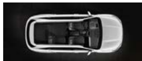
שורה שנייה מקופלת למצב שטוח לגמרי (5 מושבים)