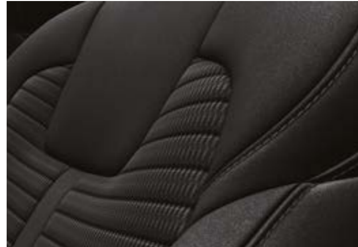
בד שחור בדגם היברידי EX/בנזין+דיזל URBAN