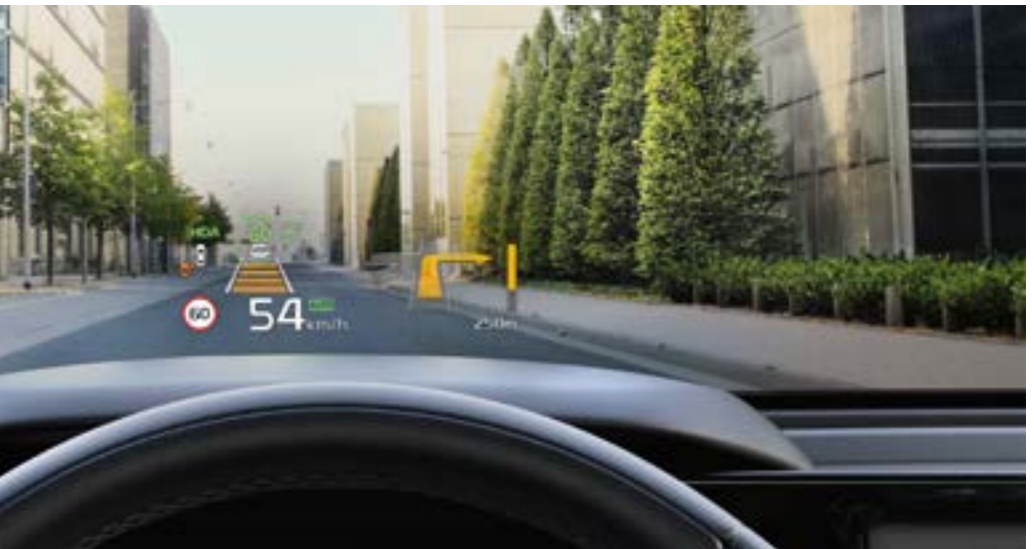
תצוגה עילית HUD* על מנת להבטיח תשומת לב מירבית לכביש, התצוגה העילית מקרינה נתונים כמו מהירות נסיעה והתראות ממערכות הבטיחות ישירות על השמשה הקדמית.