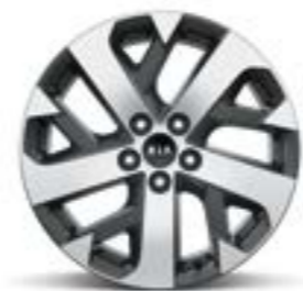
חישוקי 18 אינץ' בדגמי URBAN/EX בנזין ודיזל