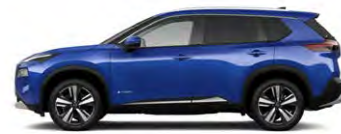
כחול ים מטאלי