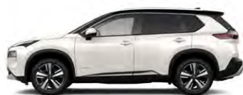
לבן פנינה מטאלי/גג שחור