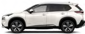
לבן פנינה מטאלי