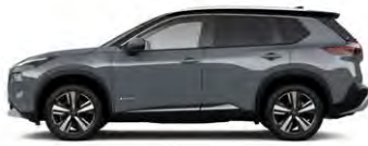
אפור פנינה מטאלי/גג שחור