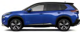
כחול ים מטאלי/גג שחור