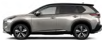
שמפניה מטאלי/גג שחור