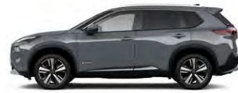
אפור פנינה מטאלי