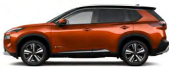
כתום מטאלי/גג שחור