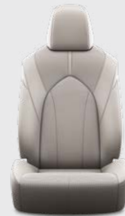
ריפוד עור בצבע אפור E-XCLUSIVE 4X4