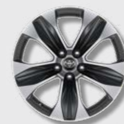
חישובי סגסוגת קלה 18" בדגם E-MOTION 4X4 בלבד