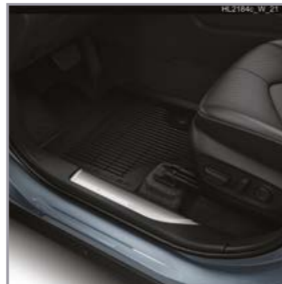
סט שטיחי גומי

שטיחי הגומי מגנים על פנים הרכב מפני לכלוך מבחוץ וניתנים להסרה לניקוי קל ופשוט