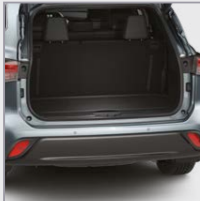
אמבטיה לתא מטען

שטיח גומי לתא מטען המספק הגנה מפני לכלוך והחלקה של ציוד וסחורה