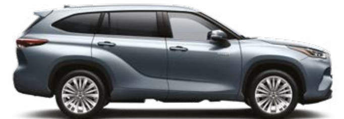
1A5 כחול טיטניום מטאלי*