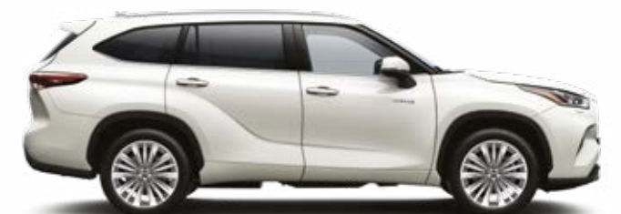
089 לבן פנינה מטאלי