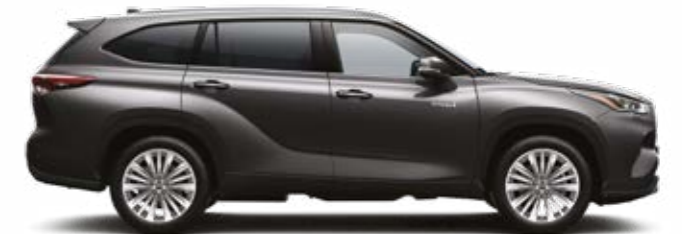
163 אפור כהה מטאלי