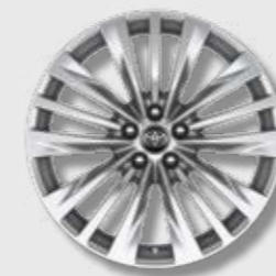
חישובי סגסוגת קלה 20" בדגם E-XCLUSIVE 4X4 בלבד