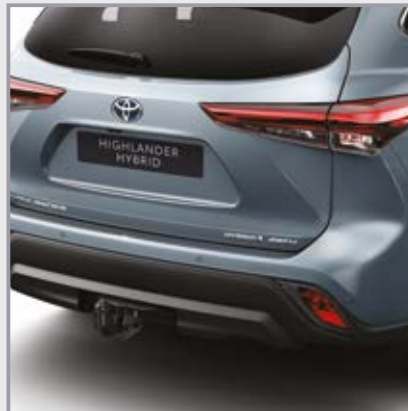
וו גרירה מקורי קבוע כולל התאמת הפגוש האחורי

וו גרירה מקורי המספק כושר גרירה גבוה המאפשר התקנה של מתקן אופניים אחורי