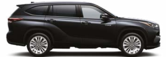
218 שחור מיקה מטאלי