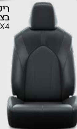
ריפוד עור בצבע שחור E-XCLUSIVE 4X4