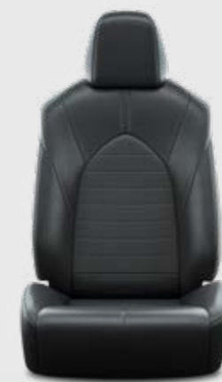
ריפוד דמוי עור בצבע שחור E-MOTION 4X4