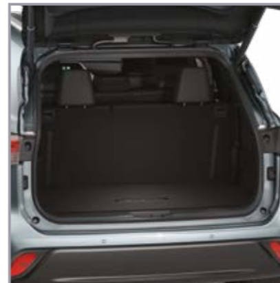
שטיח לבד לתא מטען

שטיח לבד לתא המטען המגן מפני לכלוך ומוסיף למראה האלגנטי של הרכב