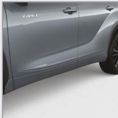
פסי הגנה לדלתות

סט פסי הגנה לדלתות בצבע הרכב המספקים שכבת הגנה לדלתות מפני שריטות ופגיעות