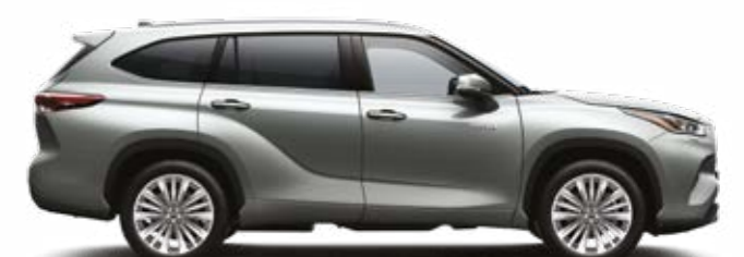
1J9 כסוף מטאלי