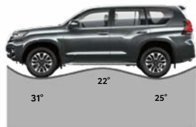
דגם ארוך זווית נטישה/גחון/גישה