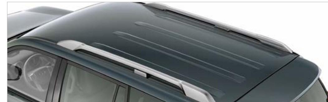
מוטות אורך (לדגם הארוך בלבד)