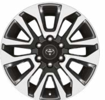
סגסוגת קלה 19" לדגמים LIMITED, SAHARA