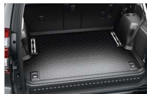
אמבטיה לתא המטען