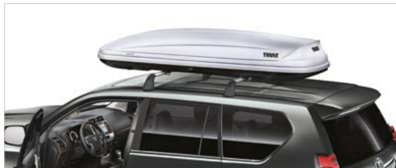
ארגז אחסון עליון THULE (בהתקנת מוטות רוחב)