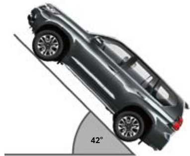
זווית טיפוס מרבית