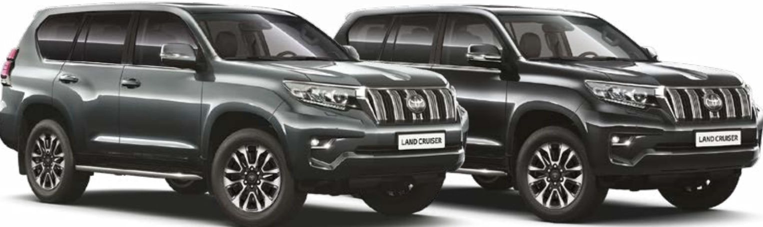
אפור כהה מטאלי 163