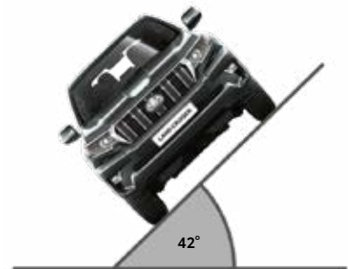
שיפוע צד מרבי