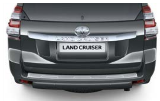
מגן שריטות תחתון