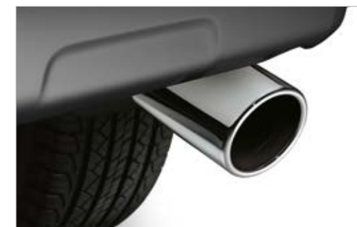
קצה אגוז ניקל