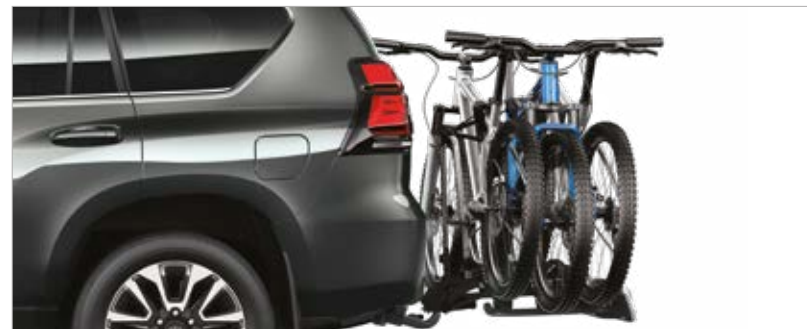
מתקן ל-3 זוגות אופניים (בהתקנת וו גרירה)