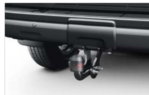
וו גרירה נשלף/קבוע