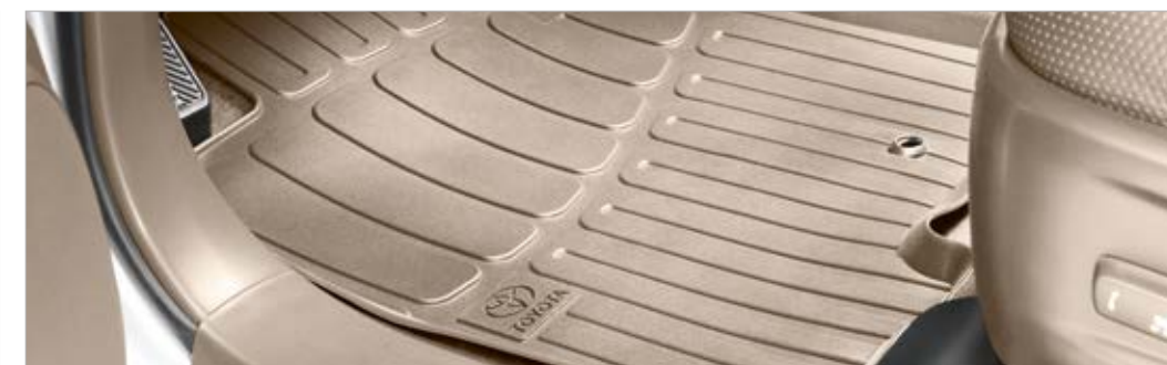
סט שטיחי גומי בצבע בז' (בנוסף לשטיחי לבד המקוריים מסופקים עם הרכב)