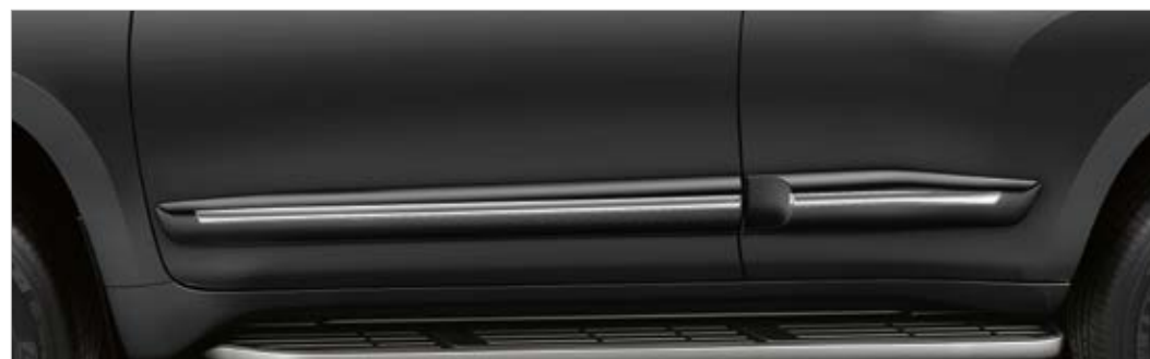
פס הגנה לדלתות עם ניקל (לדגם הארוך בלבד)