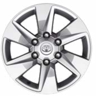
סגסוגת קלה 17" לדגמים TS7, SELECT ו-LUXURY