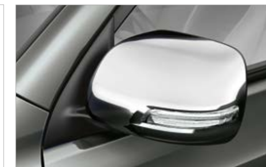
ניסוי ניקל למראות