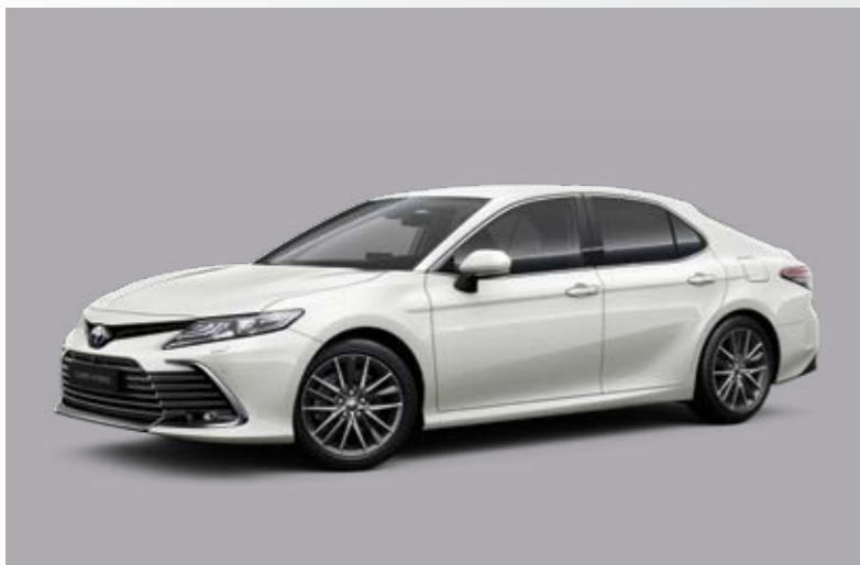
לבן פנינה מטאלי B-089