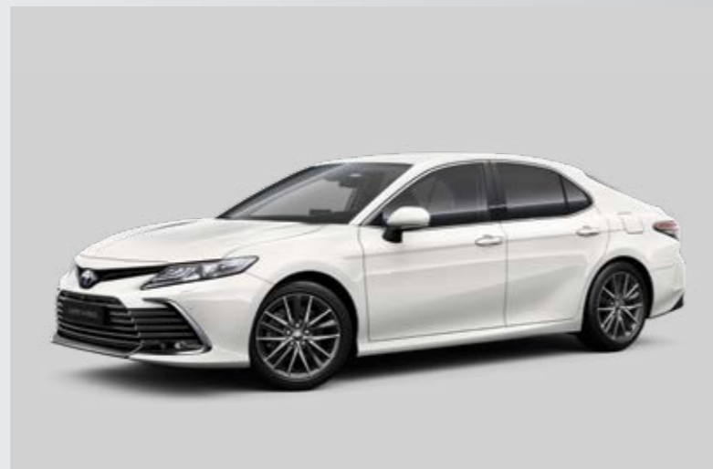
לבן צחור B-040