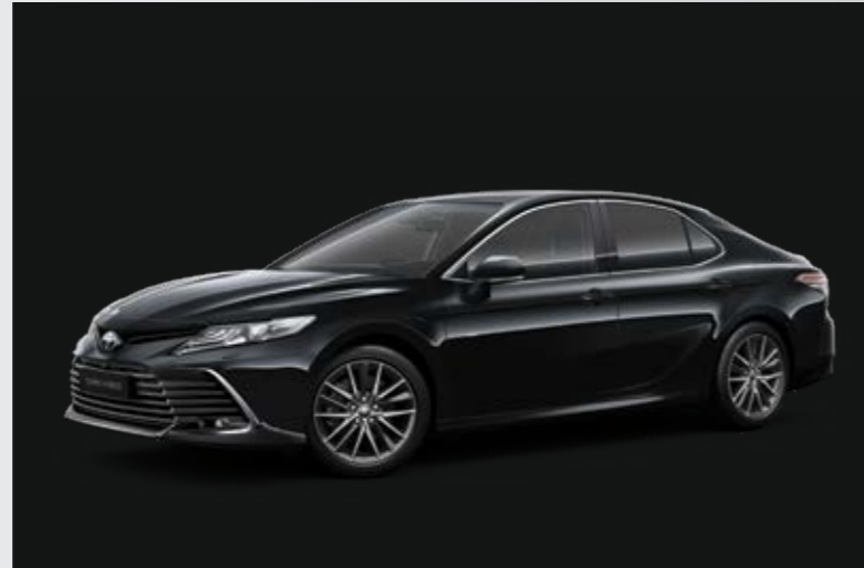
שחור מיקה מטאלי B-218