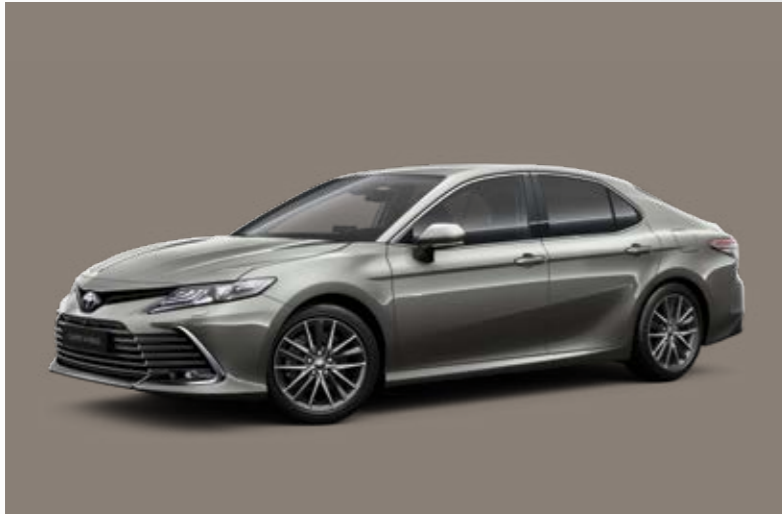
כסוף כהה יוקרתי B-1L5