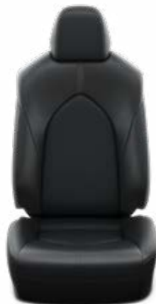
עור שחור ריפוד עור בצבע שחור, מגיע ברכבים עם צבע חיצוני לבן צחור וכסוף יוקרתי.