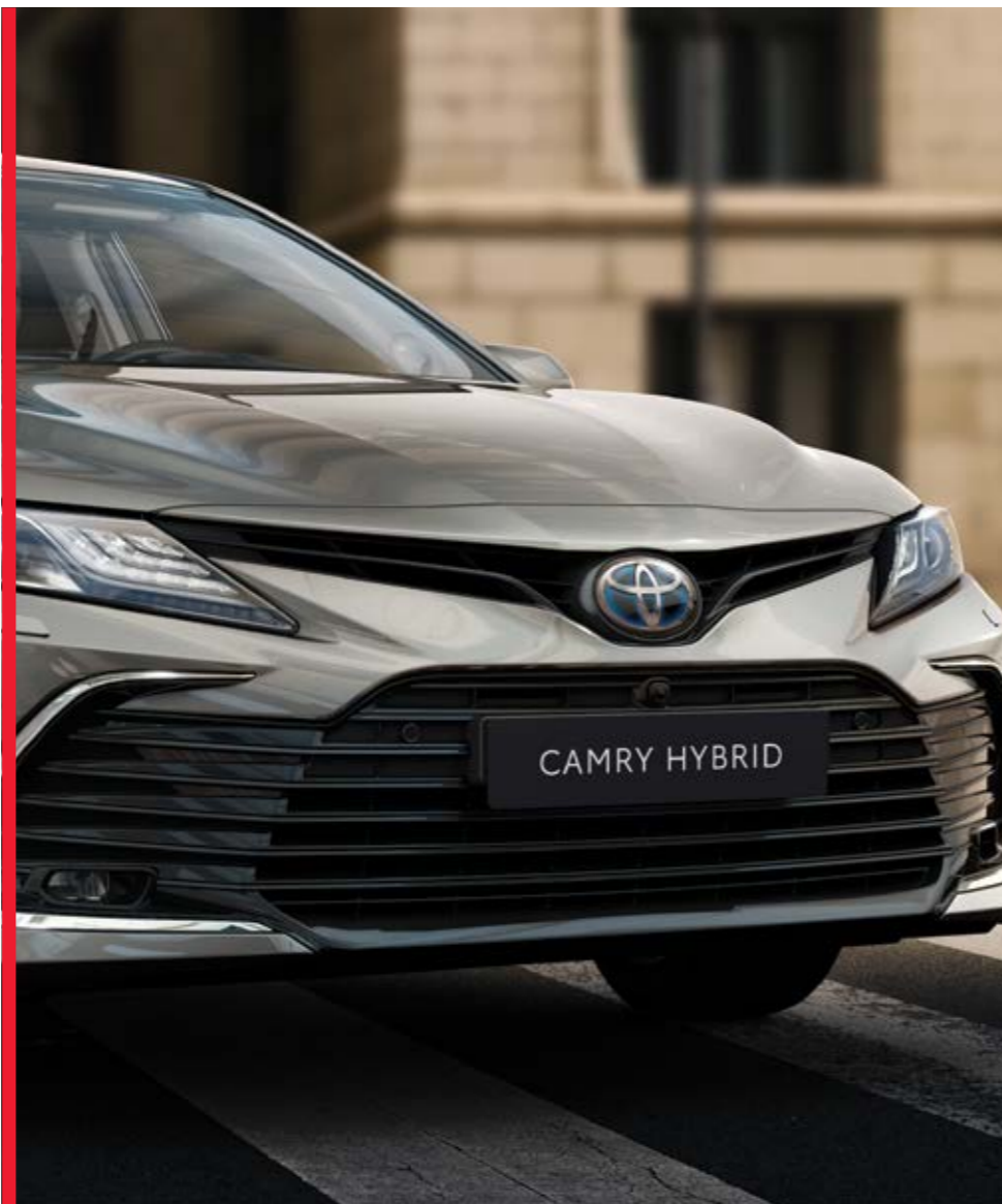
גריל חדש עם חרטום נמוך, רחב ונועז יותר המדגיש את נוכחותה המרשימה והנחושה של הקאמרי החדשה

בקאמרי ההיברידי-חשמלית החדשה יש הכל. היא משלבת בצורה מושלמת את היתרונות של מכונית מנהלים איכותית ועיצוב חדש, מרענן ויוקרתי יותר של חזית הרכב ותא הנוסעים. דבר המוסיף ליכולתה הדינמית של הקאמרי, ומשווה לה נוכחות בולטת וחזקה בכביש. התוצאה: מכונית שגם נראית מצוין, גם נוחה ומרווחת וגם מספקת חווית נהיגה ברמה של מחלקה ראשונה.