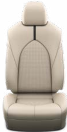
עור בהיר ריפוד עור בצבע בז', מגיע ברכבים עם צבע חיצוני לבן פנינה, שחור.