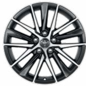
חישוקי סגסוגת קלה 18".