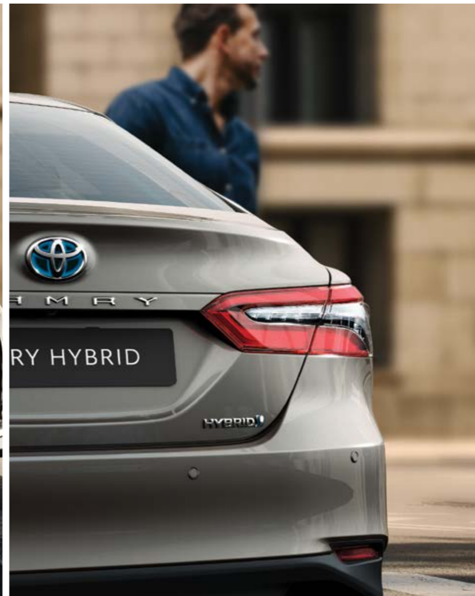
פנסי לד אחוריים שמושכים את העין, במראה עדכני ויוקרתי יותר