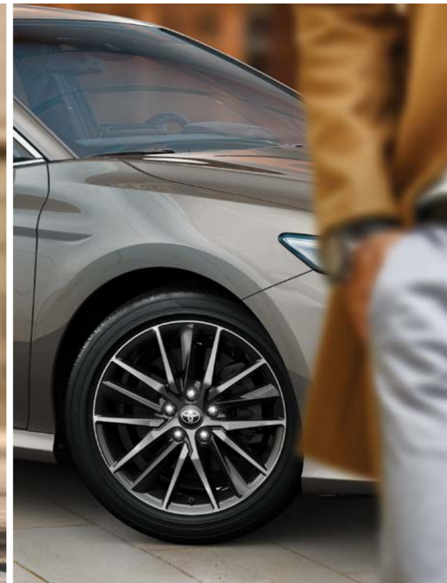
חישוקי סגסוגת קלה 18" המספקים לקאמרי מראה חד ודינמי