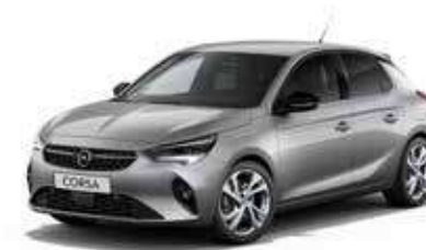
Artense | כסוף כהה מטאלי | (בדגם GS LINE בלבד)