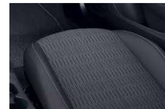
ריפוד בד שחור – "FRESEZ" – לדגמי EDITION