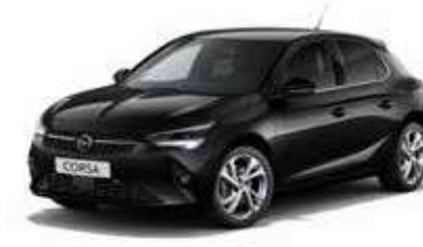
Black Perla | שחור מטאלי |