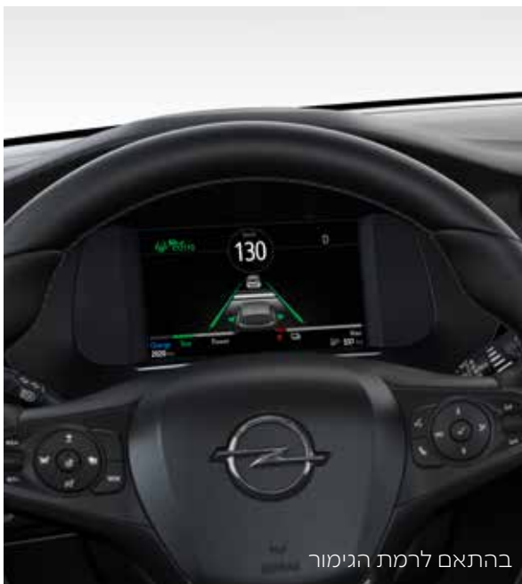
בהתאם לרמת הגימור