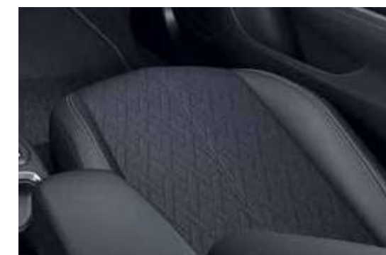
ריפוד משולב בד ועור מלאכותי – "IMAGINATION" – לדגמי ELEGANCE