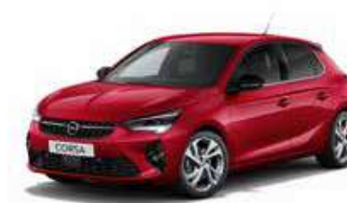
Peperoncino Red | אדום מטאלי |