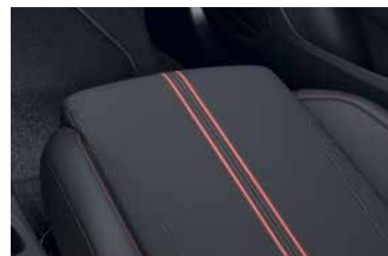
ריפוד בד שחור בשילוב פס אדום – "BANDA" – לדגמי GS LINE