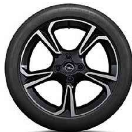
חישוקי סגסוגת 17" לדגמי ELEGANCE-I GS LINE