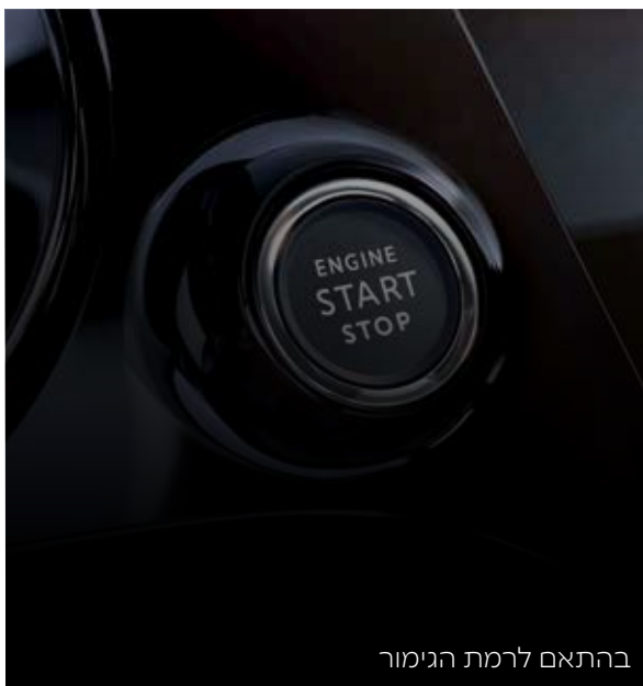
בהתאם לרמת הגימור