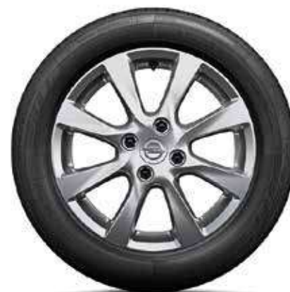
חישוקי סגסוגת 16" לדגמי EDITION