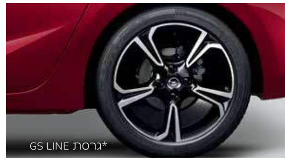
*גרסת GS LINE