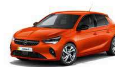
Orange Fizz | כתום מטאלי | (בדגמי e-ELEGANCE-I EDITION בלבד)