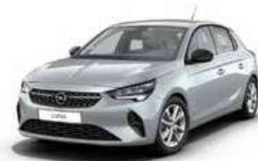
Aluminium Grey | כסוף מטאלי | (בדגמי e-ELEGANCE-I EDITION בלבד)