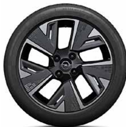
חישוקי סגסוגת 17" לדגמי e-ELEGANCE