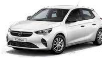
Polar White | לבן בנקיז |