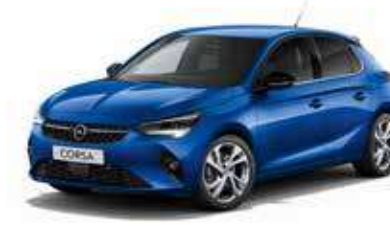
Voltaic Blue | כחול בהיר מטאלי | (בדגמי e-ELEGANCE-I EDITION בלבד)