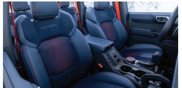
ריפוד עור כחול