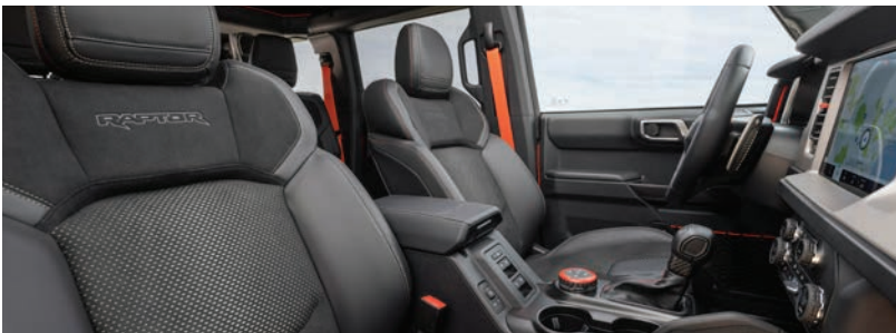
ריפוד עור שחור

* באמצעות טלפון נייד התומך ומאפשר זאת ובכפוף למגבלות שונות **פועל רק עם חלק מהמכשירים הניידים