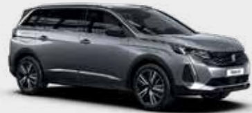
כסוף כהה מטאלי ARTENSE GREY | F4M0

לרשותך עומד מגוון רחב של צבעים שיאפשר לך להביע את עצמך באופן מלא.