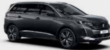
אפור כהה מטאלי PLATINIUM GREY | VLMO