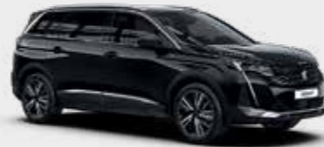
שחור מטאלי BLACK PERLA | 9VM0