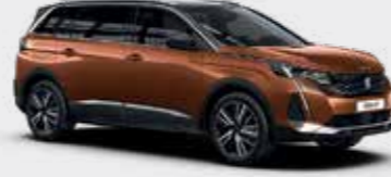
חום מטאלי METALLIC COPPER | LGM0

*צבע מטאלי בתוספת תשלום (למעט כחול בהיר)