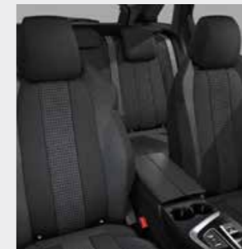
ACTIVE PACK ריפוד בד בצבע אפור כהה (בהתאם לזמינות המלאי)