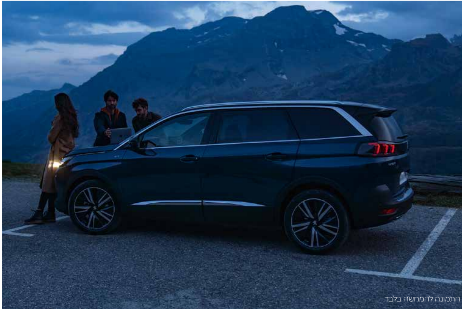
התמונה להמחשה בלבד.