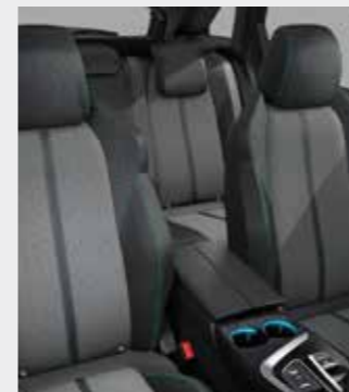
PREMIUM ריפוד בד בצבע אפור בהיר בשילוב דמוי עור