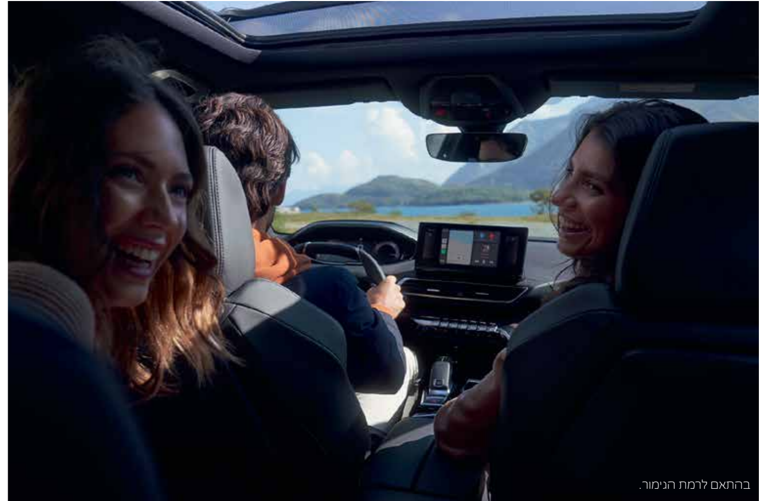
בהתאם לרמת הגימור.

הפנס האחורי המופיע בתמונות הינו להמחשה בלבד ושונה מזה שיסופק עם הרכב.