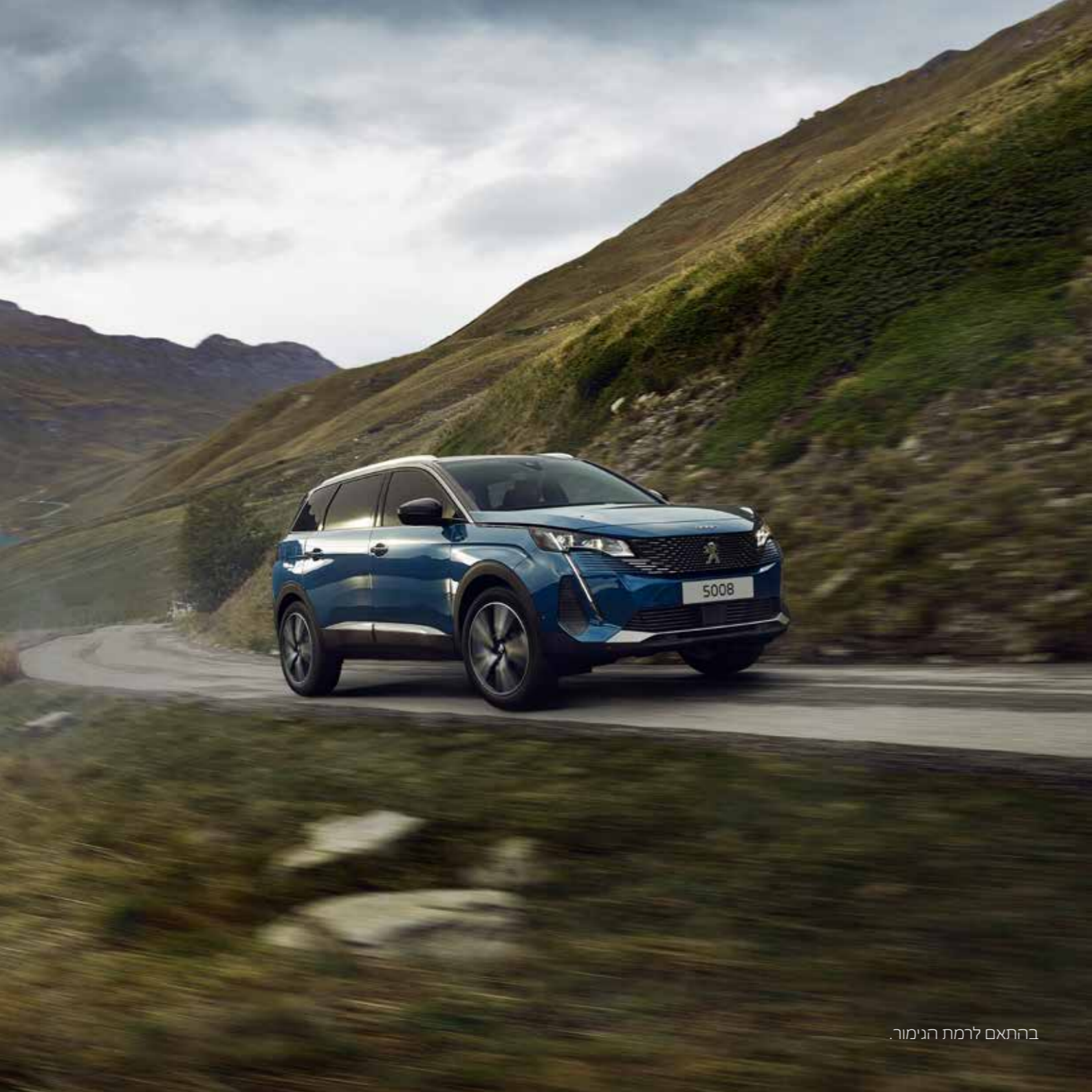
בהתאם לרמת הנימור.