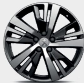
חישוקי סגסוגת 18" DETROIT

*צבע מטאלי בתוספת תשלום (למעט כחול בהיר)