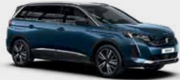
כחול בהיר מטאלי CELEBES BLUE | SYMO