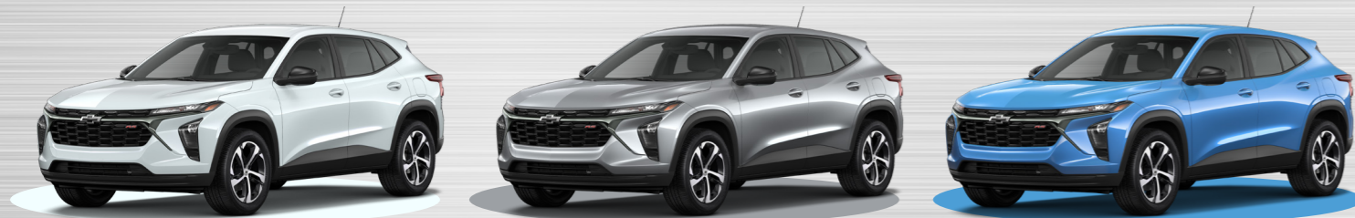
לבן פסגה - GAZ