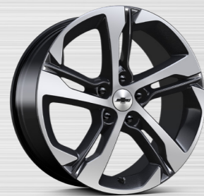
חישוקי RQH 18"