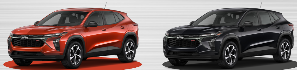
כתום טייבר לילי מטאלי - GFQ *זמין ברכות נימור 2RS בלבד