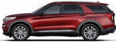
אדום מטאלי* (D4)