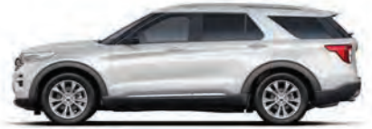
לבן (YZ) (Limited רק בדגמי)