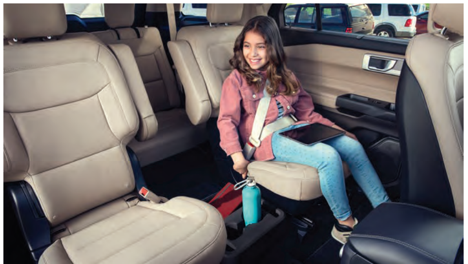
מושבי Captain בשורת המושבים השנייה, ברכב עם 6 מקומות