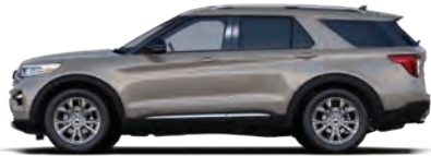
אפור אבן (D1)