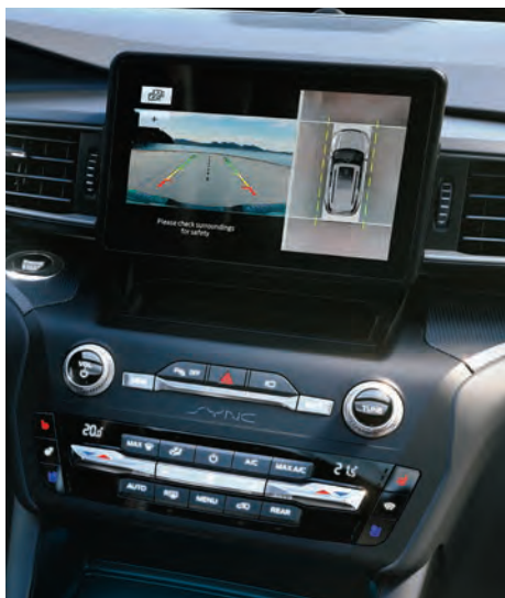
צג מגע מרכזי בגודל 8" הכולל תצוגת מצלמות היקפיות 360°

* באמצעות טלפון נייד התומך ומאפשר זאת ובכפוף למגבלות שונות ** פועל רק עם חלק מהמכשירים הניידים