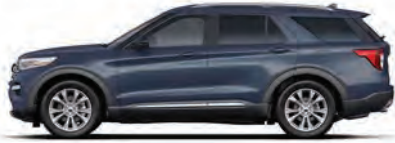
נחול כרום* (AB)