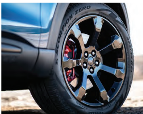
חישובי אלומיניום קלה 21" שחורים וקאליפריים אדומים