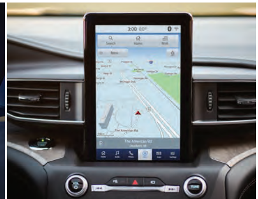
צג מגע 10.1" במרכז הקונסולה