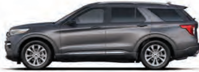
אפור קארבון (M7)