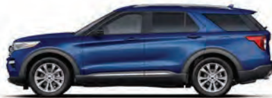
נחול אטלס (B3)