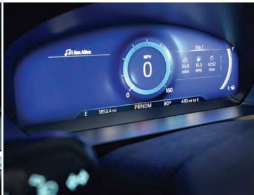
לוח מחוונים דיגיטלי 12.3"