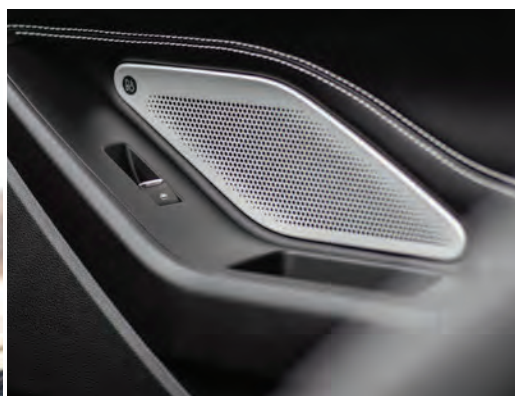
מערכת שמע B&O עם 14 רמקולים