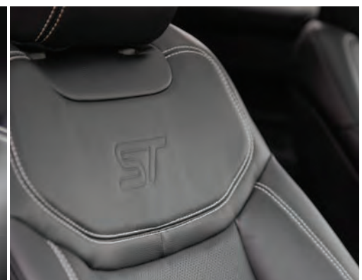
ריפודי עור בשילוב תפרים ייחודיים ולוגו ST בגון שחור