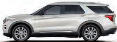
לבן נוצץ* (AZ)