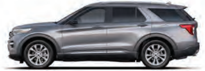
כסף אייקוני (JS)