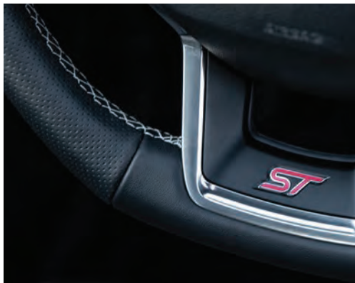
הגה מצופה עור בשילוב תפרים ייחודיים, ולוגו ST ופקדי העברת הילוכים