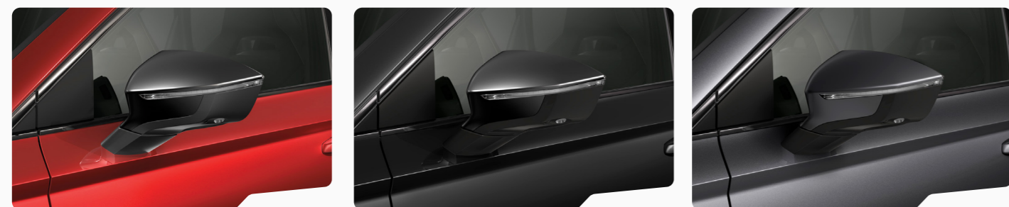
אדום מטאלי K1K1