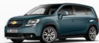
אפור כהה כחלחל מטאלי (G06)