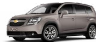
דיונה אפורה מטאלי (GH1)