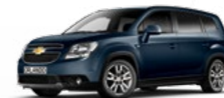
כחול ניבי (GQ3)