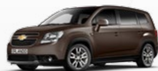
חום קפה מטאלי (GD8)