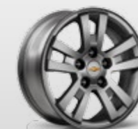
חישוק אלומיניום 16"