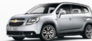
כסף מטאלי (GAN)