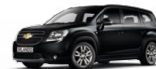
שחור מטאלי (GB0)