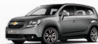
אפור מטאלי (GYM)