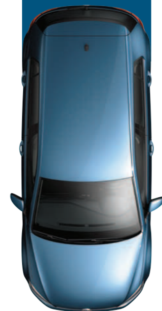
צבע מטאלי כחול Pacific D5D5