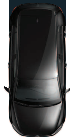
צבע אחיד אפור Urano 5K5K