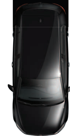
צבע פנינה שחור Deep 2T2T

בני אדם תופסים צבעים לא רק באמצעות עיניהם, עורם. גם באמצעות