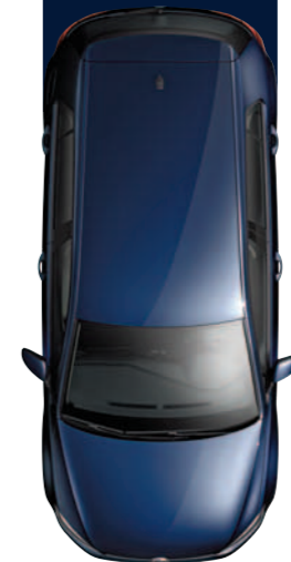
צבע מטאלי כחול Night Z2Z2