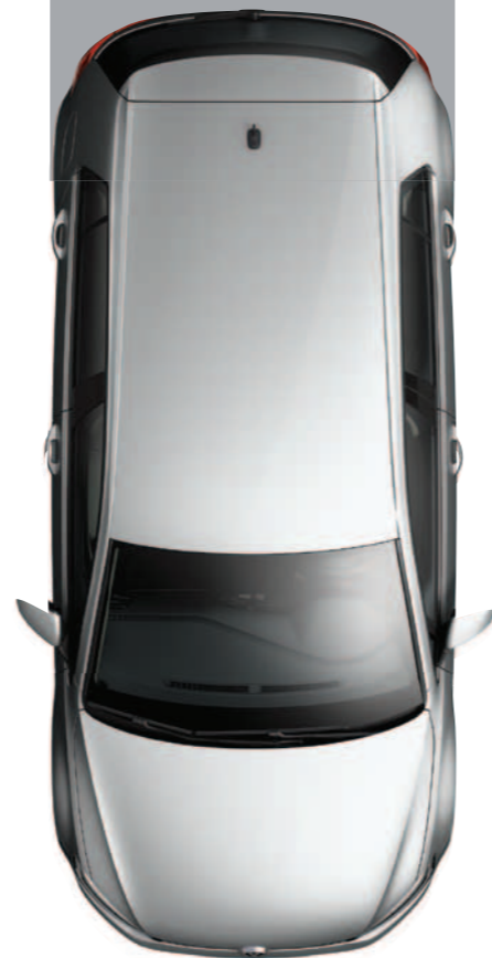
צבע מטאלי כסף Tungsten K5K5