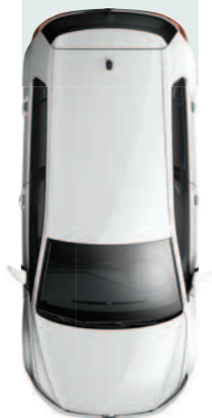
צבע אחיד לבן טהור 0Q0Q