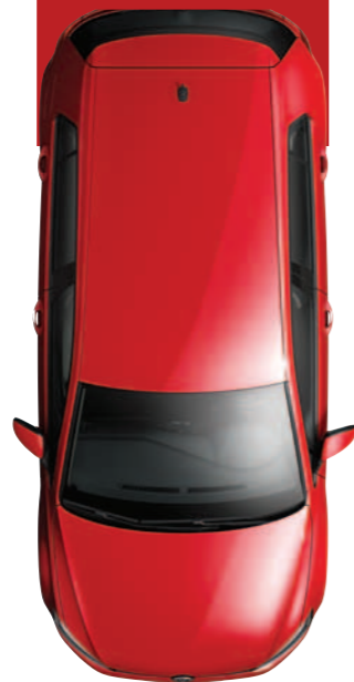
צבע אחיד אדום* Tornado G2G2