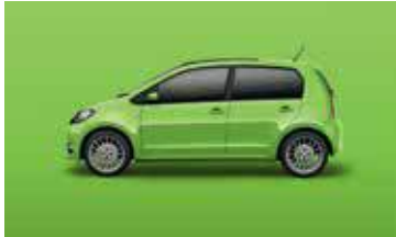
KIWI GREEN UNI 0W