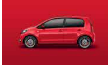
TORNADO RED UNI G2