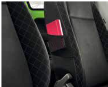
כיסוי אחסון לנייד או חפצים קטנים