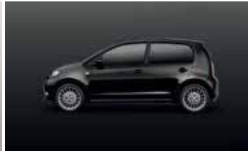
DEEP BLACK METALLIC 2T