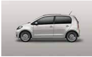
TUNGSTEN SILVER METALLIC K5