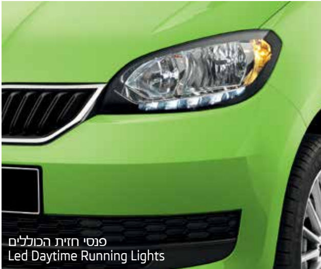
פנסי חזית הכוללים Led Daytime Running Lights