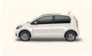
CANDY WHITE UNI B4