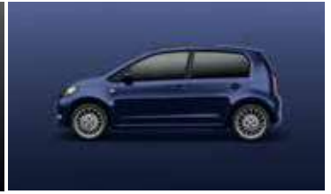
SAPHIRE BLUE S8