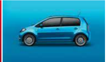
CRYSTAL BLUE METALLIC 3K