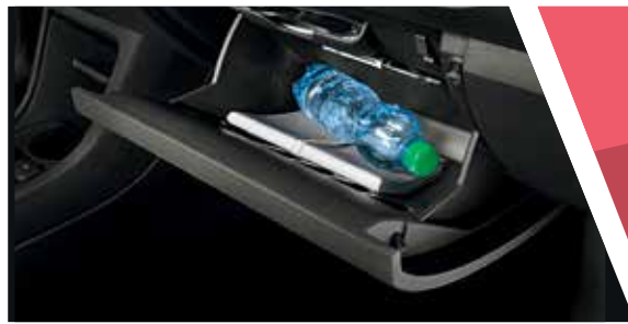
תא כפפות מחולק