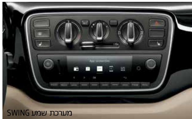
מערכת שמע SWING