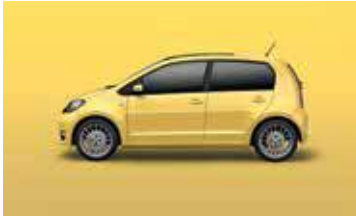
SUNFLOWER YELLOW UNI T1