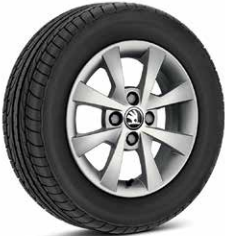
חישוקי סגסוגת 14"