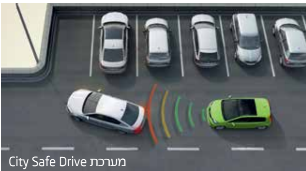
מערכת City Safe Drive