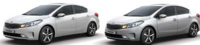
Snow White Pearl (SWP) Silky Silver (4SS)