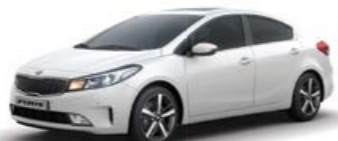
Clear White (UD)