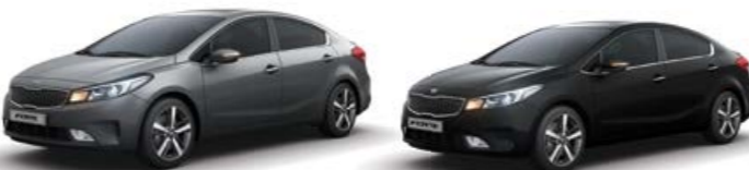
Metal Stream (MST) Aurora Black (ABP)