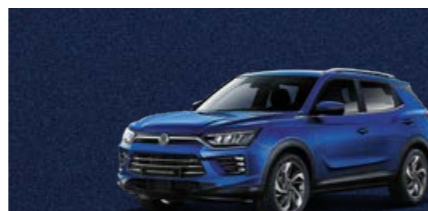
Dandy Blue (BAS)