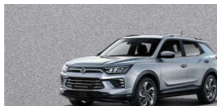
Silent Silver (SAI)