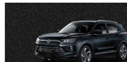
Space Black (LAK)