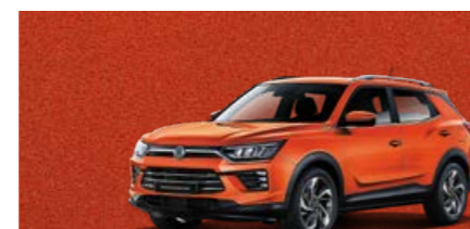
Orange Pop (RAT)