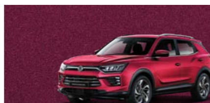
Cherry Red (RAV)