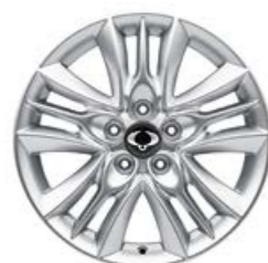
חישוקי סגסוגת 17 אינץ' עם צמיגים R17 225/60 (בדגם ל' דיזל)