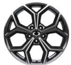
חישוקי סגסוגת 18 אינץ' בחיתוך יהלום עם צמיגים R18 235/55 (בדגם ל' בנזין)