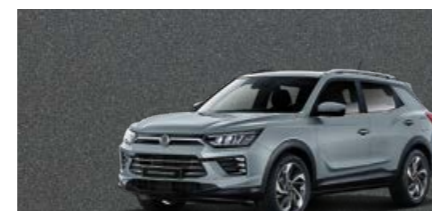
Platinum Gray (ADA)