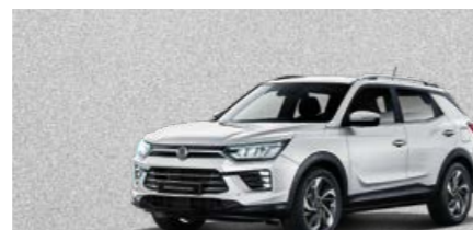
Grand White (WAA)