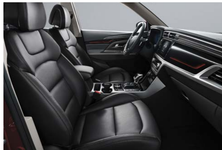
חלל פנימי שחור (LBH)