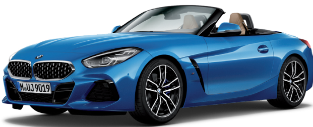
חבילת עיצוב חיצונית M-Sport, קשתות התהפכות בגימור אלומיניום (Individual Exterior Line Aluminium satinated) וחישוקי "19 דגם Double-spoke style 799 M Bicolor