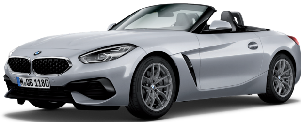
קשתות התהפכות בגימור אלומיניום (Individual Exterior Line Aluminium satinated) וחישוקי "18 דגם V-spoke style 770