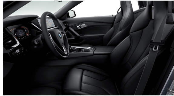
גימור פנים שחור מבריק וריפודי עור Vernasca בצבע שחור