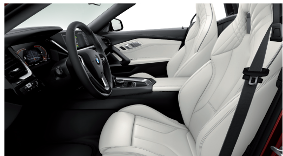
חבילת עיצוב פנימית Sport Line, גימור פנים שחור מבריק וחלק עליון של לוח שעונים ודיפון הדלתות ב-Sensatec