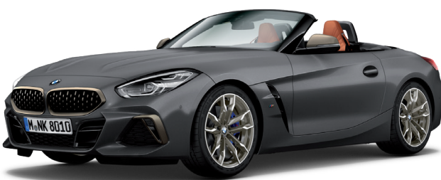
חבילת עיצוב חיצונית M Aerodynamics, קשתות התהפכות בשחור מבריק (Individual high-gloss Shadow Line) פריטי עיצוב חיצוניים ב-Cerium Grey ייחודי, חישוקי "19 דגם Double-spoke style 800 M Bicolor