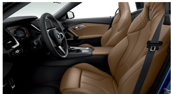
חבילת עיצוב פנימית M-Sport, גימור פנים אלומיניום וחלק עליון של לוח שעונים ודיפון הדלתות ב-Tetragon Sensatec