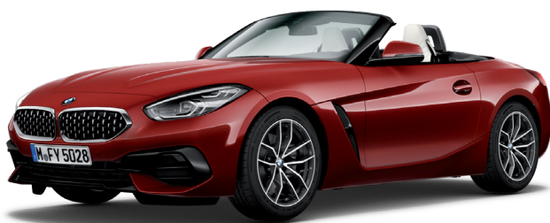
חבילת עיצוב חיצונית Sport Line, קשתות התהפכות בגימור אלומיניום (Individual Exterior Line Aluminium satinated) וחישוקי "18 דגם V-spoke style 770 Bicolor