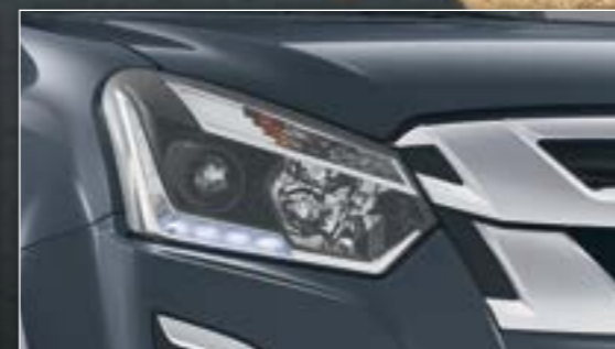
פנס ראשי פרוז'קטור משולב בתאורת יום מסוג LED