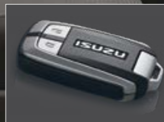
מפתח שלט חכם (בדגם LS 4x4)