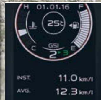
תצוגה מפורטת של מחשב דרך בדגמי LS