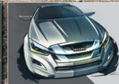
הסקיצות שהעניקו השראה לעיצוב איסוזו די-מקס