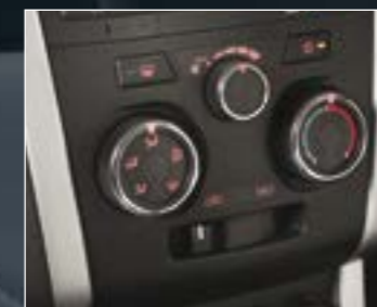
מערכת מיזוג אוויר בדגמי S