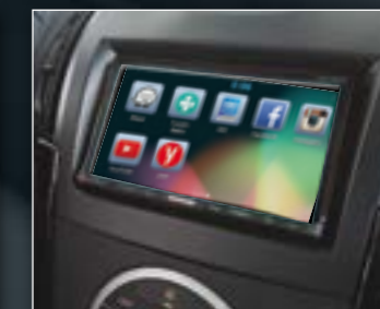
מערכת מולטימדיה אנדרואיד 7" (בכל הדגמים למעט דגם LS 4x4)