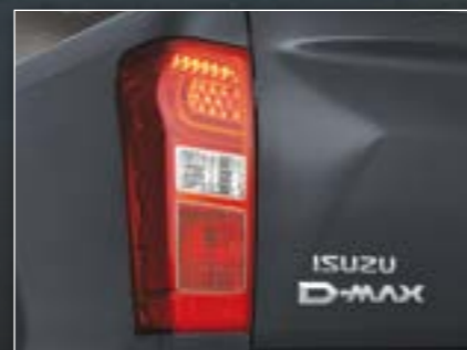
פנסי לד אחוריים (בדגם 4x4 LS)