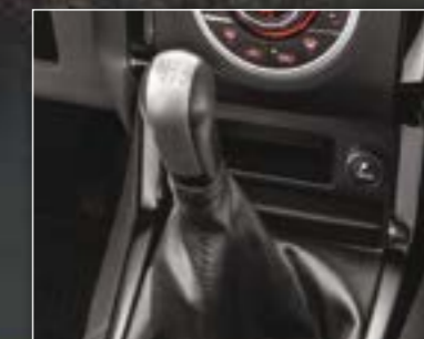
תיבת הילוכים ידנית - 6 מהירויות