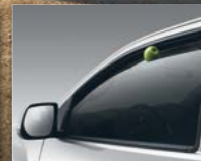
מנגנון הגנה לחלונות