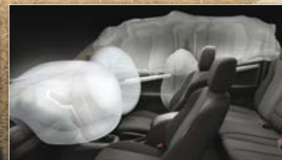
6 כריות אוויר