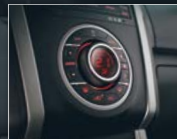
מערכת מיזוג אוויר בדגמי LS