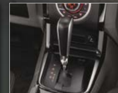
תיבת הילוכים אוטומטית - 6 מהירויות