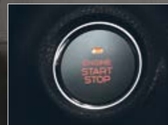
כפתור הפעיל / דומם (בדגם LS 4x4)