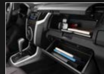
שפע תאי איחסון