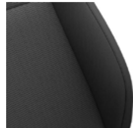
ריפוד בד שחור MK