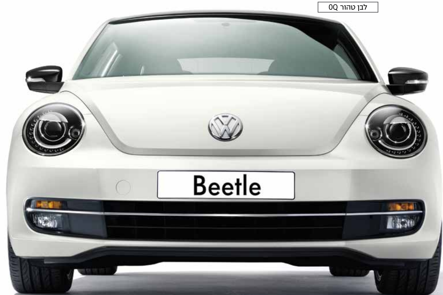
לבן טהור 0Q