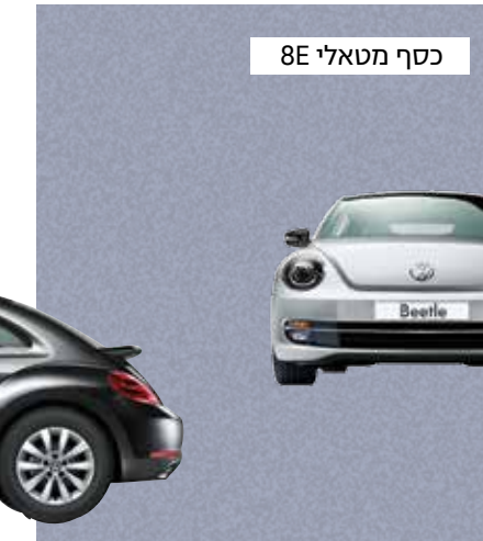
כסף מטאלי 8E