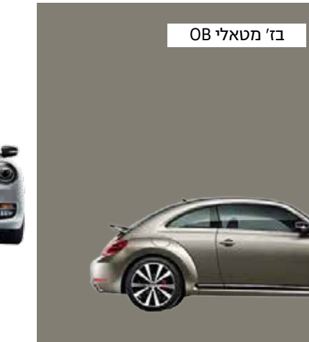
בז' מטאלי OB