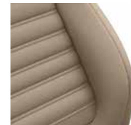
ריפוד עור Vienna בצבע בז' (בהזמנה מיוחדת)