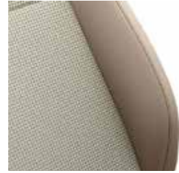
ריפוד בד בז' MW