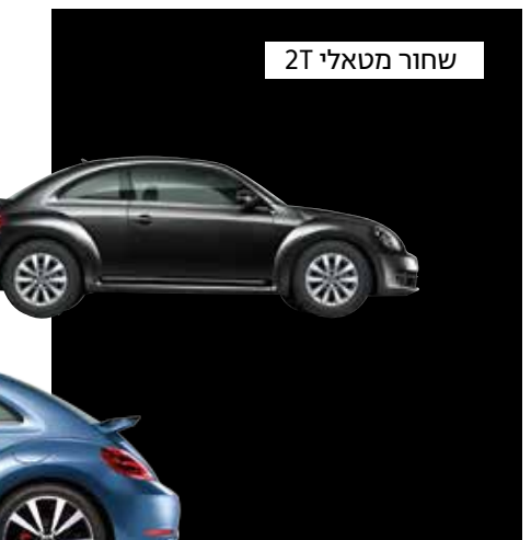
שחור מטאלי 2T