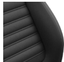
ריפוד עור Vienna בצבע שחור (בהזמנה מיוחדת)