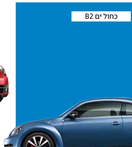
כחול ים B2