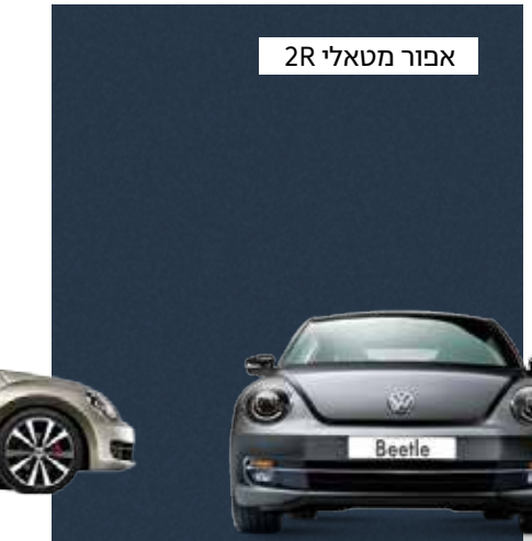
אפור מטאלי 2R