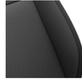
ריפוד בד שחור MX