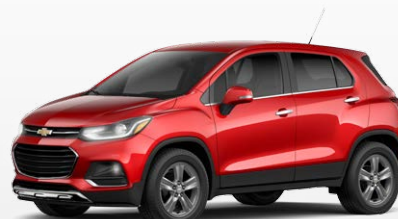
אדום בוהק (GG2)