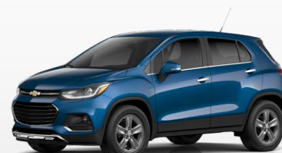
כחול מטאלי (GQM)