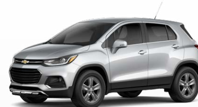
כסף מטאלי (GAN)