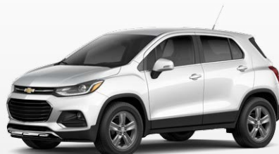
לבן מטאלי (GP5)