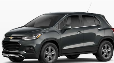
אפור כהה מטאלי (GA2)