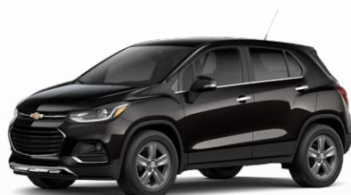
שחור מטאלי (GB0)