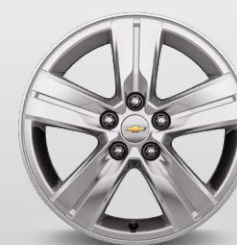
חישוקי אלומיניום (LT)