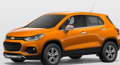
כתום מטאלי (GL5)