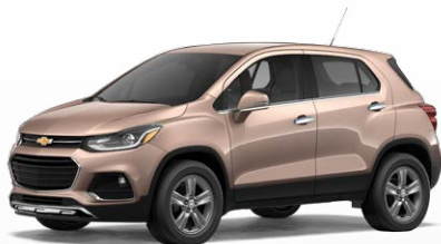
חום קוורץ מטאלי (G8R)