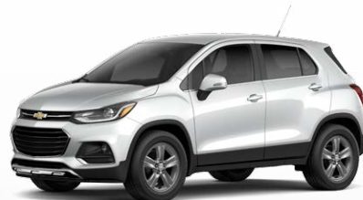
לבן פסגה (GAZ)