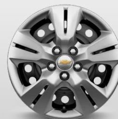
חישוקי פלדה עם חיפוי פלסטיק (LS)