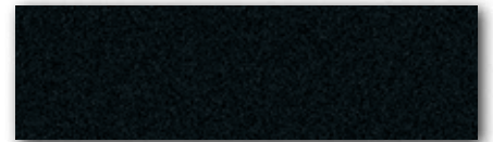
שחור מטאלי UH