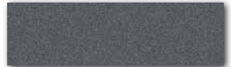
אפור סטרלינג UJ